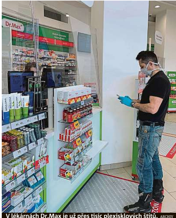
V lékárnách Dr.Max je už přes tisíc plexisklových štítů.

„Domnělá péče o zdraví tak paradoxně mohla mít na zdraví nepříznivé dopady,“ dodává Horák. Vývoj počtu výdejů léků na elektronický předpis zatím nebyl podro-