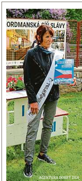
AGENTURA DOBRÝ DEN