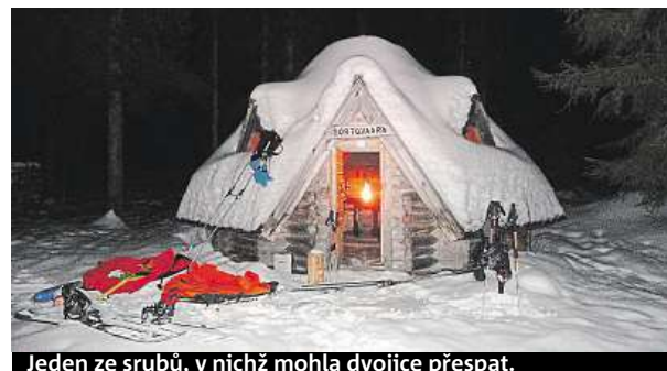
Jeden ze srubů, v nichž mohla dvojice přespát.