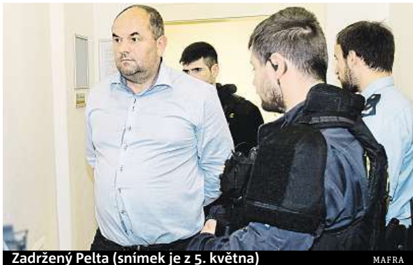
Zadržovaný Pelta (snímek je z 5. května)

O dotacích měla sice rozhodovat expertní komise, ale podle policejních dokumentů, které získal Český rozhlas, se o osudu stamilionů pro český sport rozhodovalo mezi čtyřma očima v pronajatém bytě v centru Prahy. Podle od-