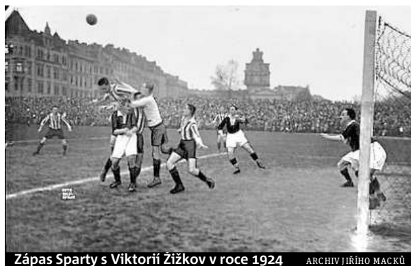
Zápas Sparty s Viktorií Žižkov v roce 1924

O čtyři roky později se klub dočkal na novém hřišti také dřevěné tribuny. Když přestavba stadionu vyhovovat zájmu fanoušků, rozhodl klub v roce 1934 o rozšíření kapaci-