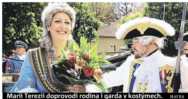
Marii Terezii doprovodí rodina i garda v kostýmech. MAFRA