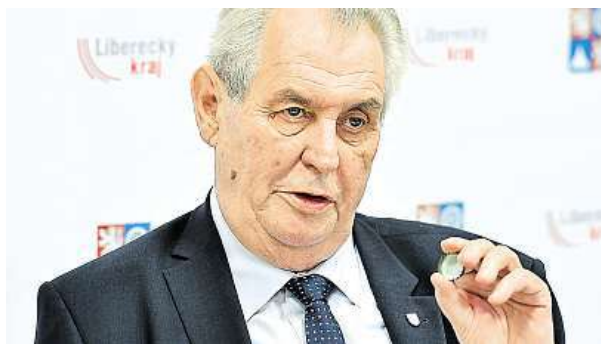
Prezident při včerejší návštěvě Libereckého kraje

Zeman se obrátí na Ústavní soud, zda je povinen odvolat Babiše.