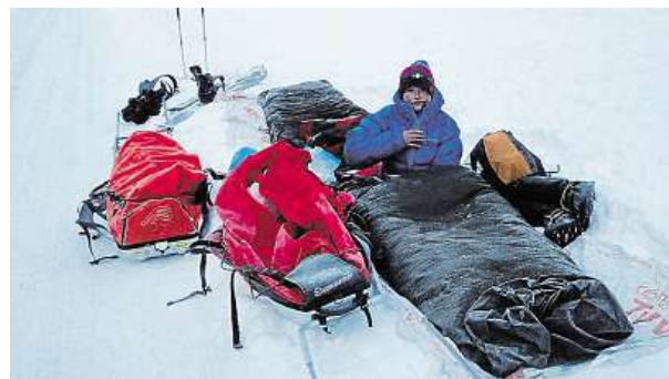
Většinu mrazivých nocí přespávali na sněhu.