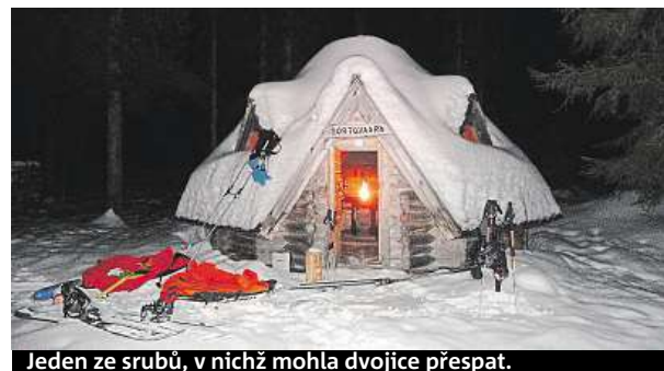
Jeden ze srubů, v nichž mohla dvojice přespát.