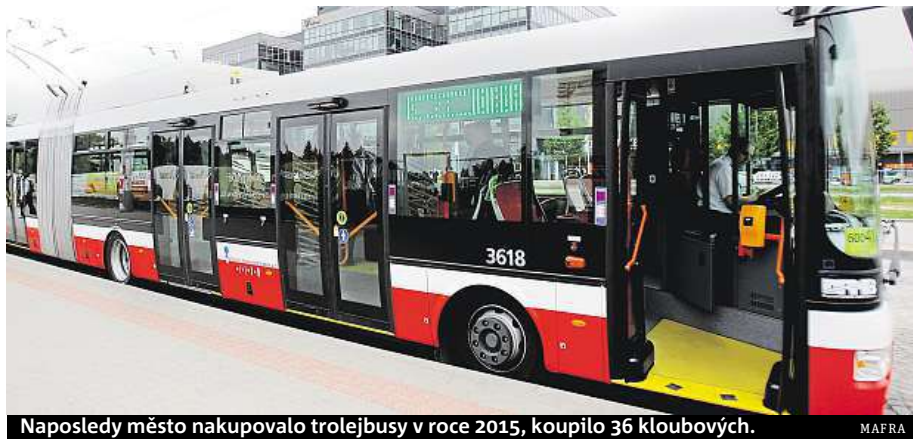
Naposledy město nakupovalo trolejbusy v roce 2015, koupilo 36 kloubových.

Naposledy město nakupovalo 36 kloubových trolejbusů v roce 2015, nejnovější krátký trolejbus je z roku 2002, typ 21Tr. Poté už získávalo ojeté vozy z menších dopravních podniků v Česku. Nové vozy umožní vyřadit nejstarší vysokopodlažní vozy 14Tr, některé jsou z druhé poloviny 80. let a prošly už několika generálními opravami i modernizacemi. Celkem má dopravní podnik 145 trolejbusů. ČTK