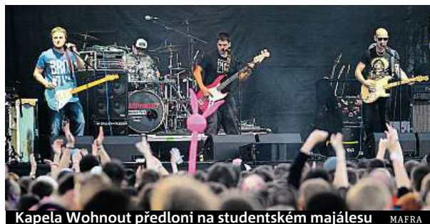
Kapela Wohnout předloni na studentském majálesu MAFRA