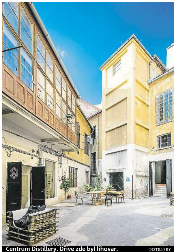
Centrum Distillery. Dříve zde byl lihovar.