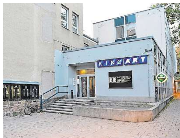
Kino Art čeká rekonstrukce.

Art hodlá dramaturgicky pokračovat ve svém programu zaměřeném nejen na artové zaměření, ale také na kvalitní mainstreamové filmy.