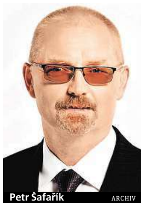
Petr Šafařík ARCHIV