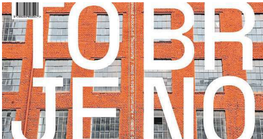
Deset osobností zve na místa, která v běžných průvodcích turisté sotva najdou.