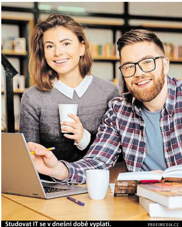
Studovat IT se v dnešní době vyplatí.

Zatímco ještě před třemi lety hledali čerství absolventi bez praxe jen těžko uplatnění, v současné době jsou právě oni skupinou, která je na pracovním trhu velmi žádaná.