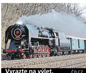
Vyrazte na výlet.

V rámci akce Královské Velikonoce na Křivoklátě budou ze Smíchova vypraveny dva expresy. Cestující s platnými zpátečními a rodinnými jízdenkami získají 20procentní slevu ze vstupného na hrad. Vlak vyrazí v sobotu a v neděli v 9.40 hodin. Více informací na old.cd.cz/zazitky . MET