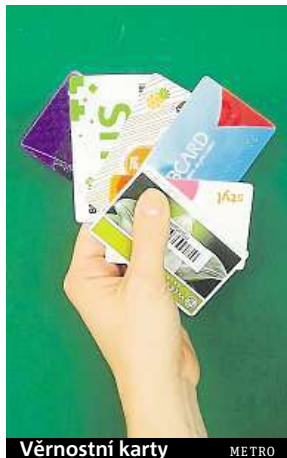
Věrnostní karty METRO

Nejvíce věrnostních kartiček v průměru vlastní (sedm) i využívají (pět) lidé v příjmové kategorii od třiceti tisíc korun čistého a více.