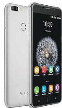
VisionBook P55 LTE MIRONET

Smartphone samozřejmě podporuje připojení k nejrychlejšímu LTE internetu a nezapomnělo se ani na možnost používat rovnou dvě SIM karty naráz. K tomu všemu navíc VisionBook P55 LTE Pro skvěle vypadá, takže až budete hledat náhradu za svůj dosluhující telefon, možná vám právě „pěadesát pětka“ příjemně zamotá hlavu.