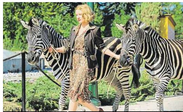
K vidění bude i film Ukryt v zoo.