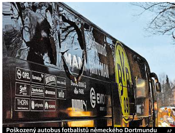
Poškozený autobus fotbalistů německého Dortmundu

Druhý zápas včerejšího programu se hrál v Turíně. Domáci Juventus překvapivě deklasoval Barcelonu 3:0. Dva góly dal v první půli Dybala, třetí přidal po pauze Chiellini. Italský celek tak má do semifinále milionářské soutěže před odvetou blíž. SIM