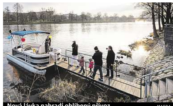
Nová lávka nahradí oblíbený přívoz.