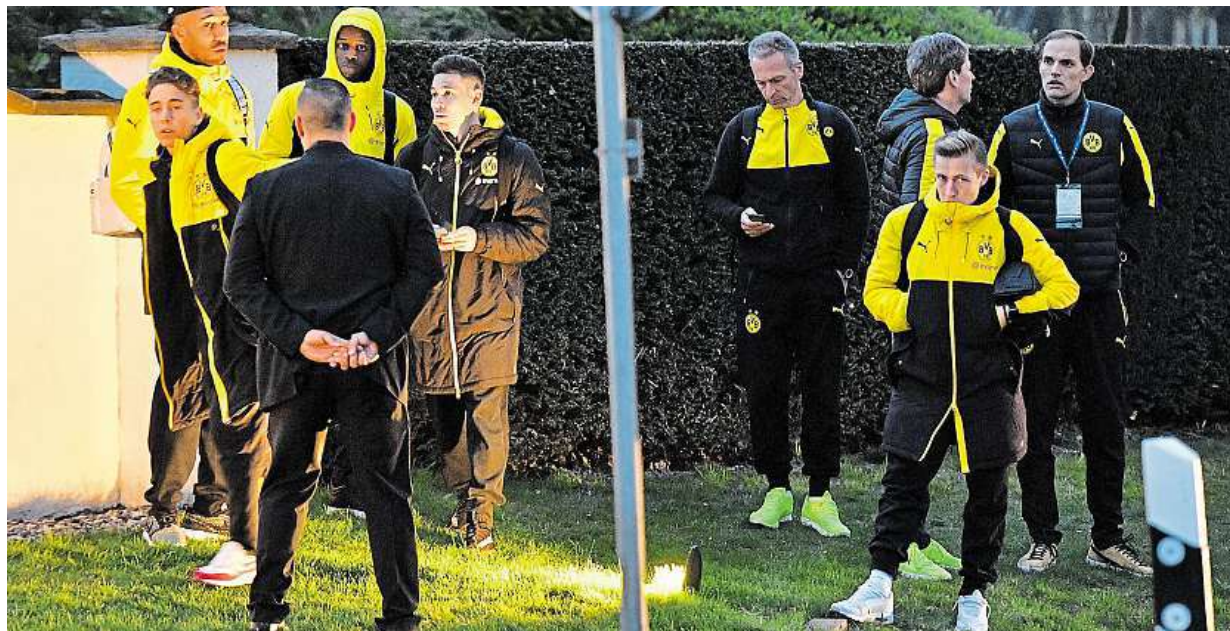
Exploze poškodily autobus fotbalistů Dortmundu, jejich čtvrtfinále Ligy mistrů proti Monaku bylo odloženo. Více strana 19

Manželská smlouva. Každým rokem jich přibývá. Rok 2016. Loni ji sepsal každý pátý pár z 50 tisíc, které uzavřely sňatek. Za kolik. Cena se odvíjí od výše majetku STRANA 5