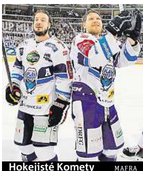
Hokejisté Komety

Modrobílá šlechta je jedna z přezdívek hokejové Komety Brno. Vedení klubu se jí asi inspirovalo i při nastavení cen vstupenek.