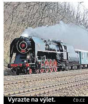
Vyrazte na výlet. cd.cz

Milovníci železniční nostalgii mohou o Velikonocích vyrazit parním exprem na hrad Křivoklát. V rámci akce Královské Velikonoce na Křivoklátě budou vypraveny dva expresy, a to v sobotu a v neděli. Vlak vyjede z pražského Smíchova v 9.40 hodin. Cestující s platnými zpátečními a rodinnými jízdenkami získají 20procentní slevu na vstupném do hradu. Více na old.cd.cz/zazitky . MET