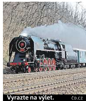
Vyrazte na výlet.

Milovníci železniční nostalgii mohou o Velikonocích vyrazit parním exprem na hrad Křivoklát. V rámci akce Královské Velikonoce na Křivoklátě budou vypraveny dva expresy, a to v sobotu a v neděli. Vlak vyjede z pražského Smíchova v 9.40 hodin. Cestující s platnými zpátečními a rodinnými jízdenkami získají 20procentní slevu na vstupném do hradu. Více na old.cd.cz/zazitky . MET