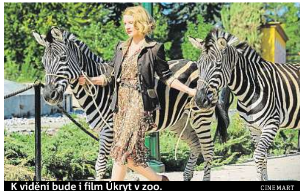
K vidění bude i film Ukryt v zoo.