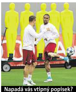
Napadá vás vtipný popisěk?

Napište bublinu a reagujte na sloupek na: www.facebook.com/denikmetro