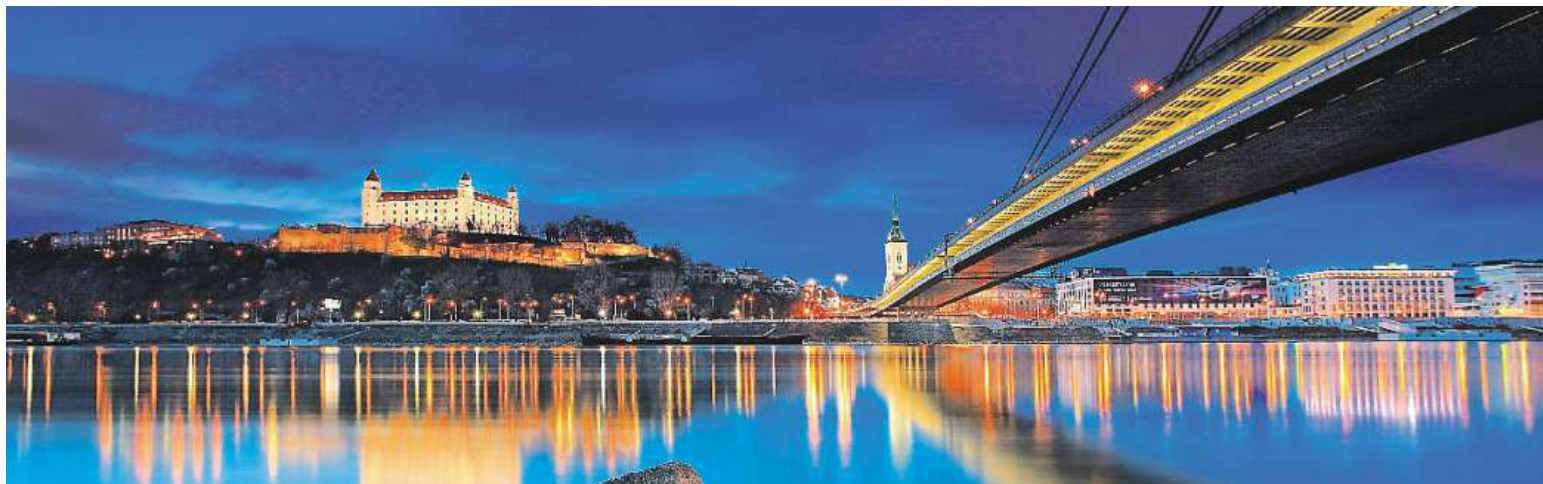
Vzdušná Bratislava je ideální na víkendový výlet. Svoje chuťové pohárky mohou její návštěvníci uspokojit v mnoha restauracích.