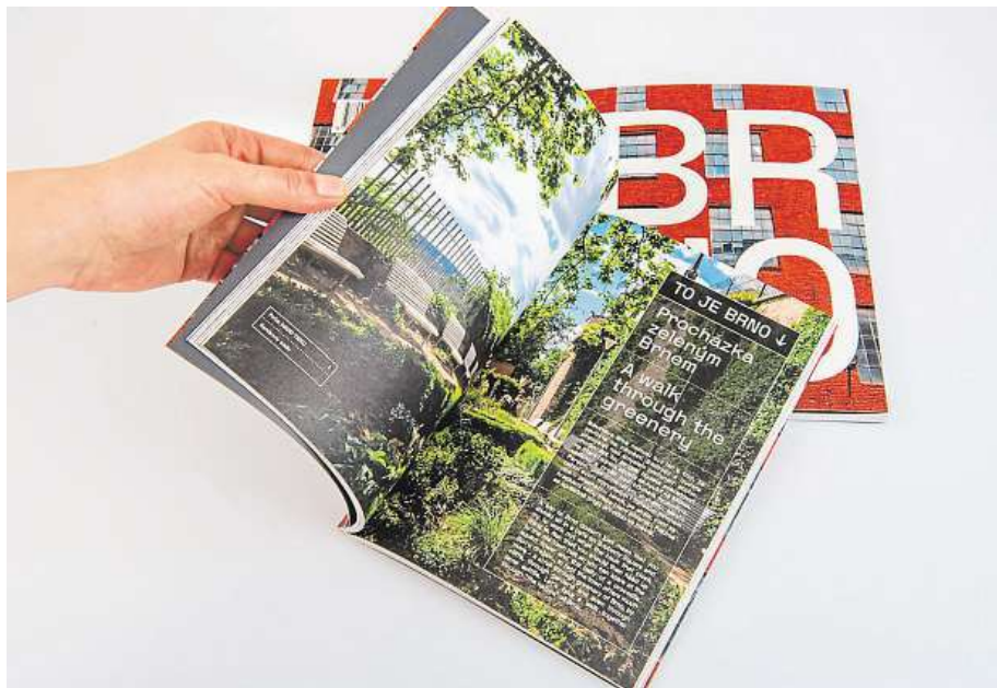
Jedna z kapitol se nazývá Zelené Brno, další zase Noční život.