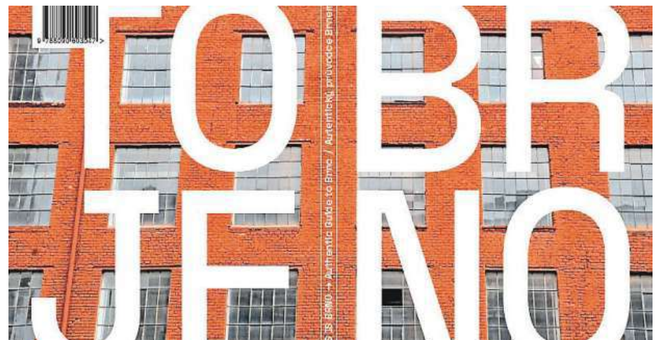
Deset osobností zve na místa, která v běžných průvodcích turisté sotva najdou.