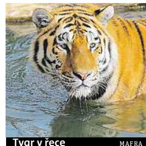
Tygr v řece

Statistiky byly zveřejněny před schůzkou ministrů tří