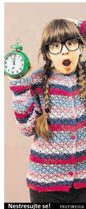
Nestresujte se!

Imunitu posiluje i dostatek spánku, pestrá strava s dostatečným množstvím zeleniny, probiotika, která jsou součástí střevní mikroflóry, jež souvisí s imunitním systémem, ale také enzymy, bez nichž by nemohly probíhat žádné biochemické procesy v těle. Některé enzymy v našem těle totiž řídí i správné fungování imunity. KAMILA HUDEČKOVÁ