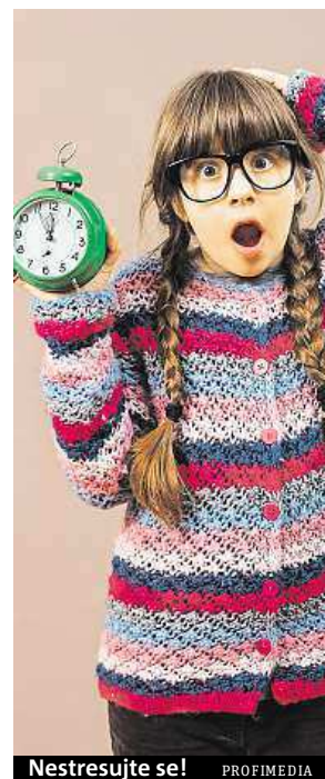
Nestresujte se!