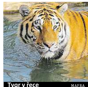
Tygr v řece

Statistiky byly zveřejněny před schůzkou ministrů tří-