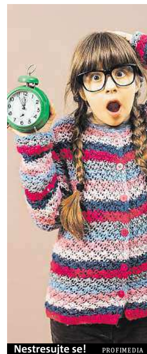
Nestresujte se!