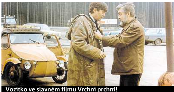
Vozítko ve slavném filmu Vrchní prchni!