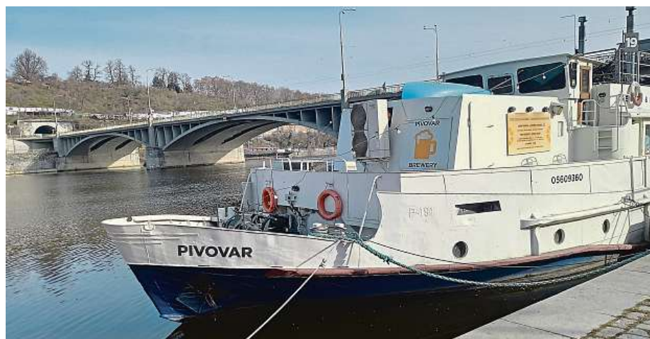
Přejmenovat loď prý nosí smůlu, podnikatel a politik to ale risknout tak trochu musel. Loď pořízená z druhé ruky v Hamburku se původně jmenovala Classic Queen. A to neznělo právě pivovarnicky.