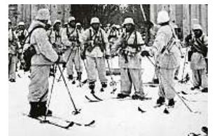
Finská lyžařská četa 3x PROFIMEDIA

Krátce před Vánoci byl Sovětský svaz vyloučen ze Společnosti národů, fronta stagnovala. Ránu sovětské prestiži léčila propaganda: Záludného protivníka podporuje tisíc