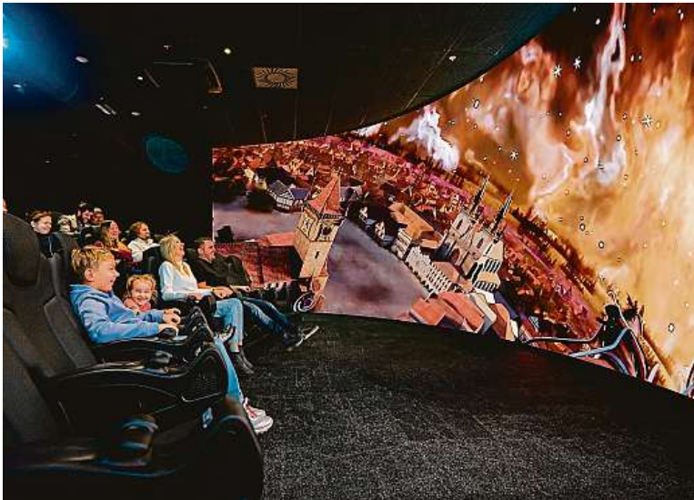
5D kino je unikátní. Sledujete příběh na obrovském zakrouceném plátně a vše se hýbe.