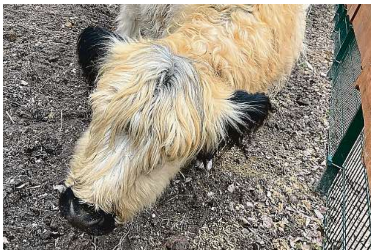
Farmapark u Toma je budován jako kontaktní.