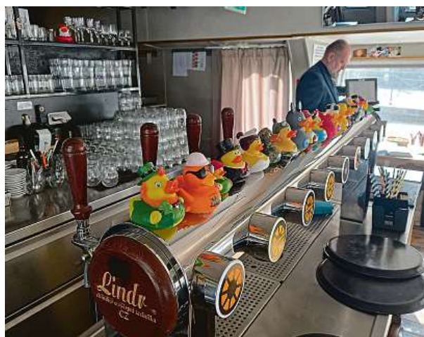
Výčepem v lodní restauraci protéká například i místní cenami ověřená tmavá třináctka s názvem Monarchie.

Na lodi je 280 míst k sezení. Ryvola rád žertuje o tom, že má ráno při výběru místa, kde posnídá, těžké rozhodování. JAR