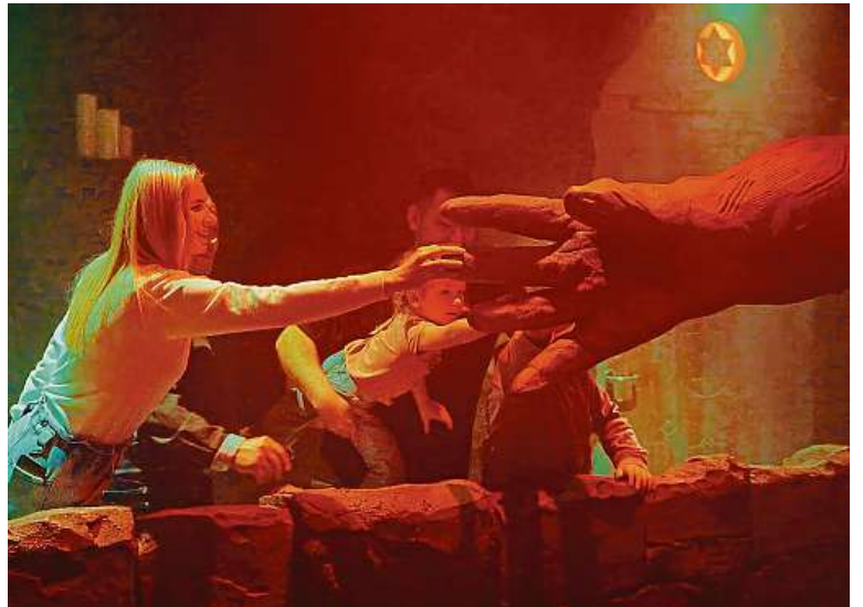
Probudit bájného golema chce trochu odvahy. Jde z něj vážně strach.