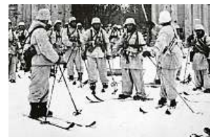
Finská lyžařská četa

Krátce před Vánoci byl Sovětský svaz vyloučen ze Společnosti národů, fronta stagnovala. Ránu sovětské prestiži léčila propaganda: Záludného protivníka podporuje tisíc