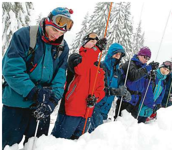
Sehnat odborníka, kterého firma potřebuje pro svůj další rozvoj, může být těžší než pátrání po pohřešovaném v lavině.

Ukazuje se například, že generace lidí, kteří mají za sebou pět až deset let pracovních zkušeností, ale i ti, kteří nyní do praxe přicházejí ze