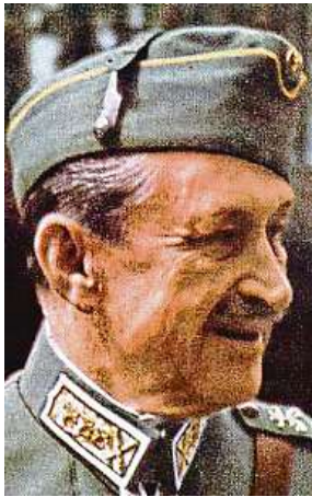
C. G. Mannerheim byl v letech 1944–1946 prezidentem Finska.

Před 85 lety se uzavřela zimní válka. Malí Finové se v ní heroicky prali s obrem z Moskvy.