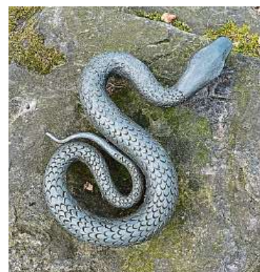
Ždírecká zoo je tematický park s dřevěnými a kovovými sochami zvířat.