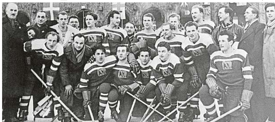
Československý tým z hokejového šampionátu v roce 1949

Zklamaní reprezentanti se týž den sešli v restauraci U Herclíků, nazývané Zlatá hospůdka, poblíž pražského Národního divadla. Rozčilení hráči si nebrali servítky a začala padat ostrá slova na adresu režimu. To už byli ovšem pod dohledem příslušníků Státní bezpečnosti, která vzápětí začala zatýkat. „Pamatuj-