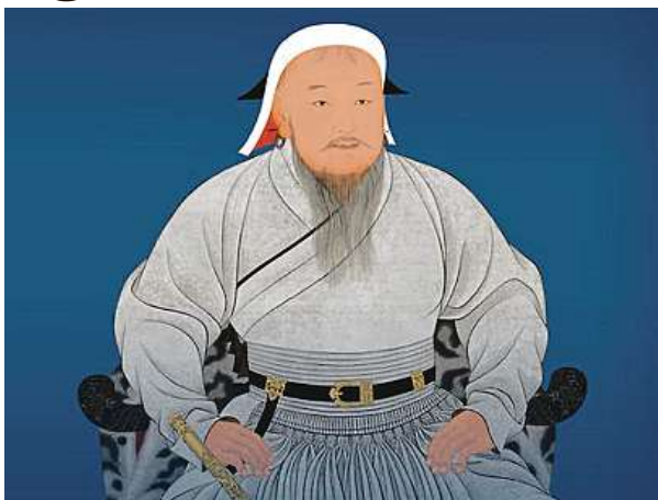
Čingischán (na obrázku) je hlavní hvězdou výstavy. Vstupenky lze zakoupit on-line, v aplikaci, automatu či na pokladně.

Náplň výstavy se podle zástupců muzea nesoustřeďuje pouze na život a dobu legendárního dobyvatele a zakladatele jedné z největších historických říší. Nabídne také jedinečné předměty světového kulturního dědictví, které jsou v zahraničí prezentovány jen zcela výjimečně, a to ze sbírek Národního muzea Čingischán v mongolském Ulánbátaru a z Archeologického ústavu Mongolské akademie věd. Výstava, od které si Národní muzeum slibuje zvý-