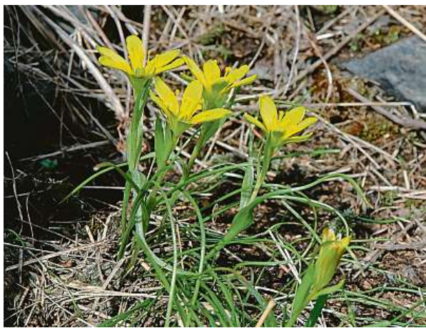
V zahradě kvete i křivatec český pravý. Jedná se o kriticky ohroženou cibulovinu, která je typická pro oblast Prahy a středních Čech. BZHP

Témata jednotlivých prohlídek navazují na dané roční období nebo výstavu či akci, které v zahradě probíhají. Společně s kurátory si návštěvníci v průběhu celé sezony projdou celý areál botanické zahrady a seznámí se blíže s jednotlivými expozice-