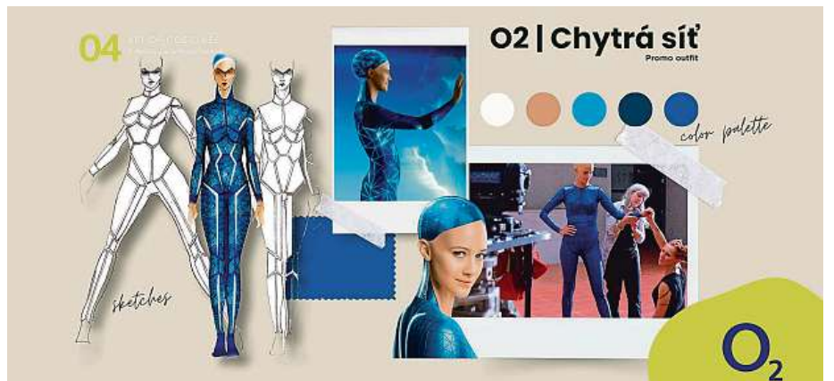
Aby byl kyborg dokonalý, vytvořila progresivní designérka postupně čtyři varianty modrého svítícího oblečku. Idea byla, aby kromě obličeje, uší a rukou neměla robotka na sobě už žádnou viditelnou tkáň.