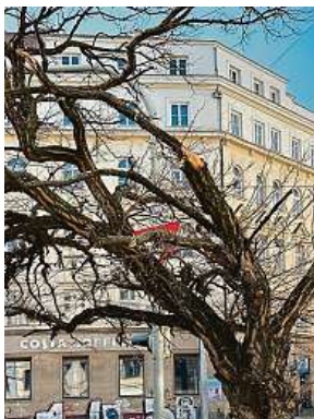
Stromy na náměstí v Praze 7 mají nejlepší léta za sebou.

„Stromům chybí prokořenitelný prostor, půdní vzduch, a hlavně voda, které je ale v prostoru při každém