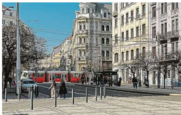
Životodárné kořenové cesty v pražských ulicích jsou podle zástupců TSK více než revoluční. Nově vzniknou i na „Strossmayeráku“.