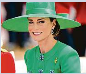
Kate Middletonová

Přední světové zpravodajské agentury stáhly fotografii princezny Kate, kterou v neděli zveřejnil Kensingtonský palác, kvůli podezření, že s ní bylo manipulováno. Princezna později úpravu sama přiznala a omluvila se, že někoho mohla zmást.