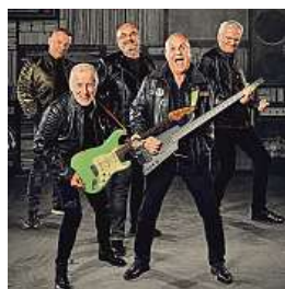
Skupina Elán BRAINZONE

Největší hity skupiny Elán s předním symfonickým tělesem. Takové spojení zatím žádný fanoušek jedné z nejslavnějších československých kapel nikdy neslyšel. Ta přidává třetí koncert do O2 areny a poprvé v kariéře na něm českému publiku zahraje se symfonickým orchestrem. Vystoupení nazvané Elán Rock Symphony uzavře 7. února 2025 tři koncerty v největší pražské hale, první dva proběhnou už na podzim. „Podle našich zkoušek usuzuji, že to bude bombové,“ říká Jožo Ráž s tím, že smyčce a dechy hudbě Elánu dodají ještě větší sílu a energii. Lístky budou v prodeji zítra od 10.00 na ticketmaster.cz a ticketportal.cz. MET