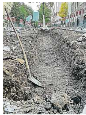
Výkopy mají smysl. Tenhle byl loni v Krkonošské ulici. MET

Nově vysazené stromořadí navrátí Strossmayerovu náměstí také jeho původní historický ráz. Dosavadní krátkové nízké akáty totiž zastoupí o poznání sošnější břestovec Juliin, díky němuž naváže charakter prostoru na svou podobu mezi čtyřicátými a osmdesátými lety, kdy zde stromy dorůstaly až do třetího patra okolních domů.