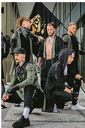
Hrdinů má prý Vaverová kolem sebe víc než dostatek.