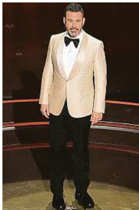
Jimmy Kimmel

„Ještě nikdy tu nebyl horší moderátor Oscarů než Jimmy Kimmel,“ uvedl zde Trump na adresu slavného baviče a moderátora. „Jeho úvodní řeč působila dojmem, kdy se podprůměrný člověk strašně snaží být někým, kým není a nikdy nebude. Zbavte se Kimmela a možná jej nahraďte jiným opraným, ovšem alespoň levnějším talentem z ABC Georgem Slopanopoulosem. Vedle něj bude každý na jevišti vypadat větší, silnější a hvězdnější,“ pokračoval