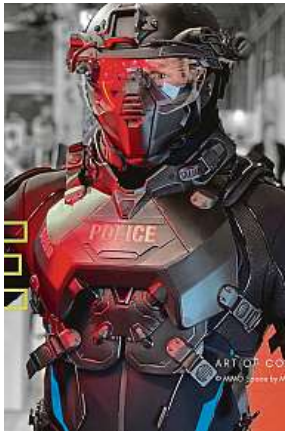
Kostým pro seriál od Netflixu Evropské kmeny 5x MIMO SPACE