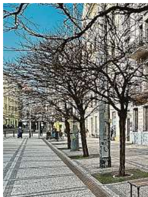
Stromořadí se již brzy promění a dřeviny dostanou víc místa.

„Na konci stavebních prací bude celý systém opět zakryt dlažbou a všechny procesy budou probíhat skrytě, aniž by způsobovaly jakákoli omezení v prostoru náměstí,“ popisuje Lišková.