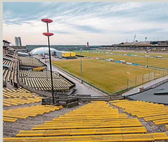
O prohlídku útrob jednoho z největších sportovních stadionů světa je velký zájem. OPEN HOUSE PRAHA – RADOMÍR KOČÍ