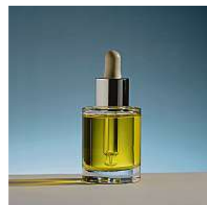
Přiměřená skin care rutina je přínosná pro pleť.