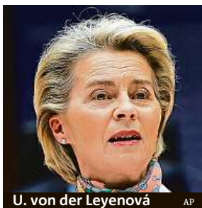
U. von der Leyenová

K cestě za sluníčkem budeme potřebovat „propustku“. Podobu dostane už za pár dnů.