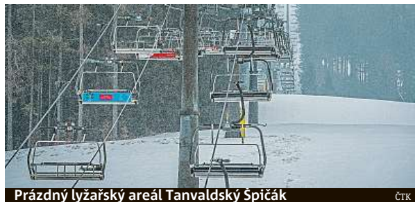
Prázdný lyžařský areál Tanvaldský Špičák