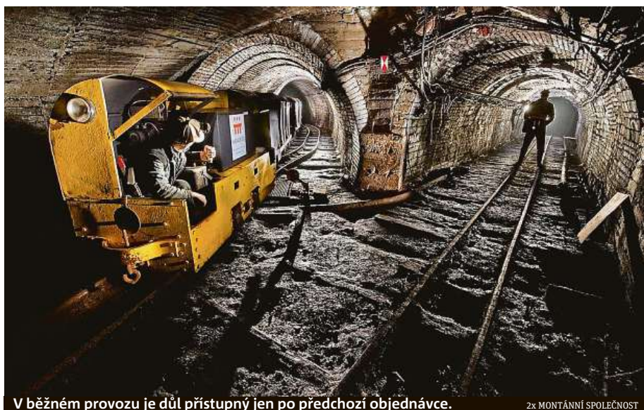
V běžném provozu je důl přístupný jen po předchozí objednávce.