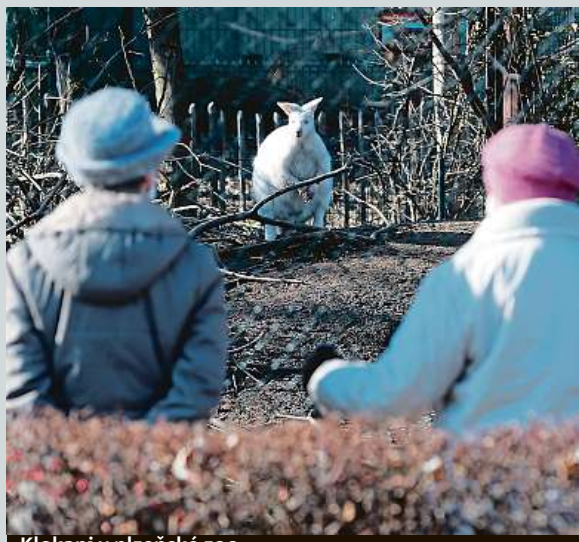
Klokani v plzeňské zoo

Česká obchodní inspekce v jižních Čechách a na Vysočině loni zkontrolovala 70 e-shopů, chyby byly u 70 procent z nich. Šlo o neúplné informace v obchodních podmínkách. Větší je také seznam rizikových e-shopů, u nichž není jasné, kdo je provozuje. Letos se ČOI dál zaměří na prodeje respirátorů a roušek. ČTK