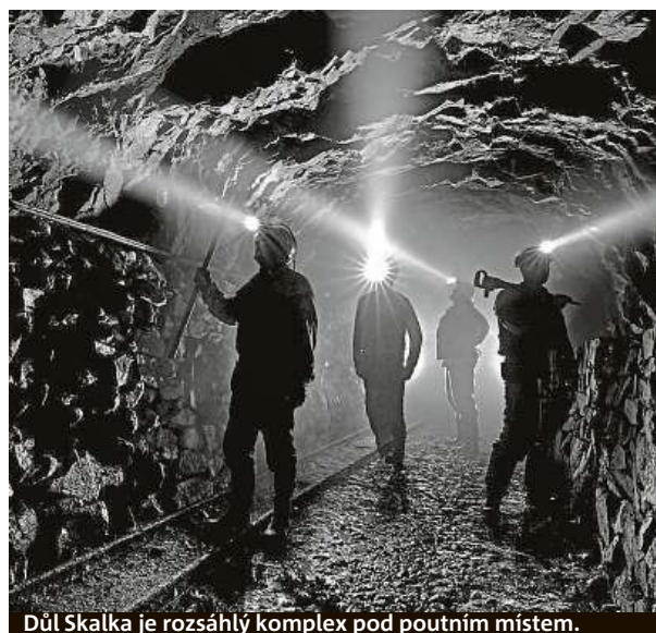
Důl Skalka je rozsáhlý komplex pod poutním místem.