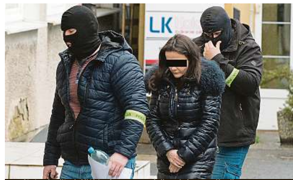
Policisté přivádějí jednu ze zadržených soudkyní.