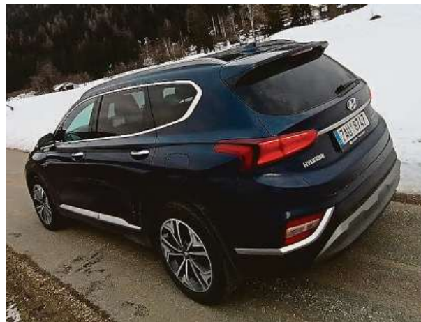
Auto je oproti předchozí generaci o osm centimetrů delší.

Protáhli jsme několika státy vlajkovou lodí Hyundai. To auto neuvěřitelně vyrazilo.