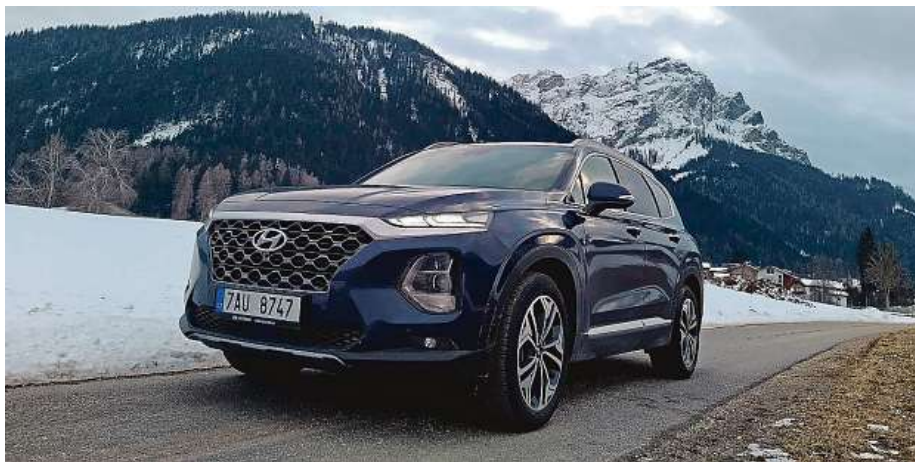
Pohon všech kol jsme vyzkoušeli na horských zledovatělých silnicích.