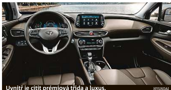
Uvnitř je cítit prémiová třída a luxus.

Santa Fe je příkladem, kam se kategorie středně velkých esúvček posunula. Ta tam je prodloužená verze, která se ještě s minulou generací nabízela. Pokud měla první generace auta 4,5 metru, tato čtvrtá má 4,77 a je k máni pouze