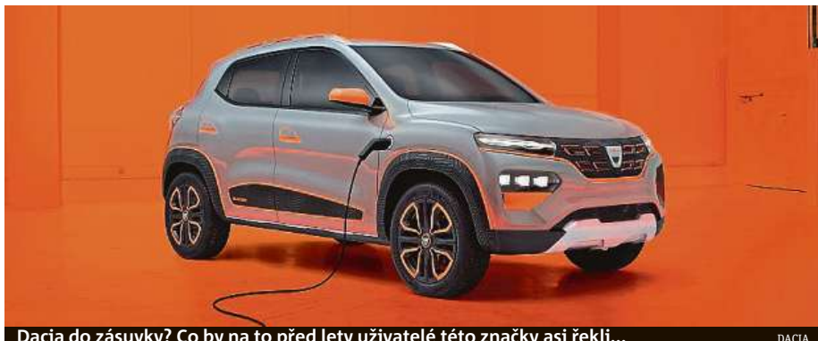
Dacia do zásuvky? Co by na to před lety uživatelé této značky asi řekli...