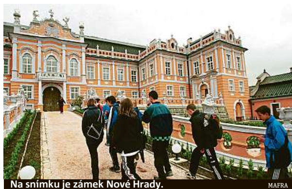
Na snímku je zámek Nové Hradky.