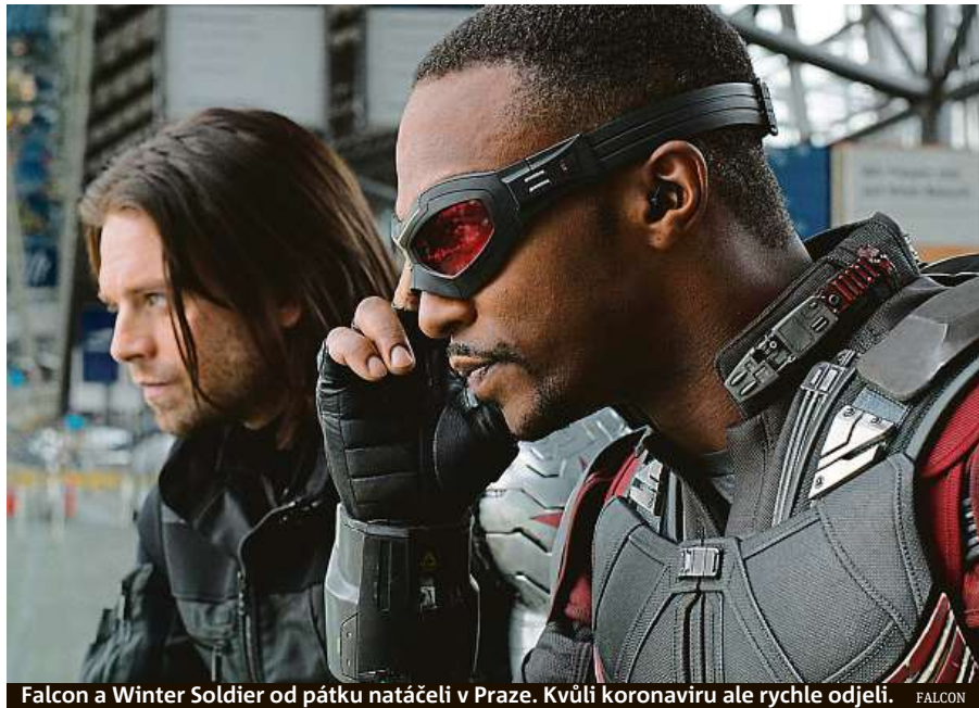
Falcon a Winter Soldier od pátku natáčeli v Praze. Kvůli koronaviru ale rychle odjeli. FALCON