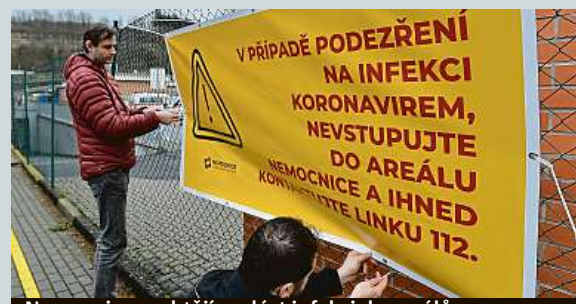
Nemocnice nechtějí zavléct infekci do areálů.