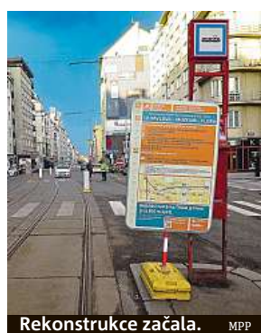
Rekonstrukce začala. MPP

„Nejsem příliš spokojen s tím, že proběhne v některých částech jen v dočasném řešení a některé povrchy a zastávky budou dostavěny až rok poté. Bohužel jsme v tomto rozběhlém projektu již nemohli dostatečně zaurgovat koordinaci prací, kterou se neudálo mým předchůdcům podchytit. Stav tramvajové trati už neumožňuje výluky od-