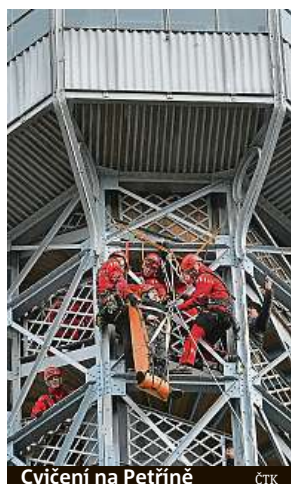
Cvičení na Petříně

Hyundai Santa Fe – kombinovaná spotřeba: 5,6–9,4 l/100 km, emise CO 2 : 147–215 g/km; Hyundai Tucson – kombinovaná spotřeba: 4,7–7,9 l/100 km, emise CO 2 : 123–180 g/km; Hyundai KONA – kombinovaná spotřeba 4,1–7,1 l/100 km, emise CO 2 : 109–160 g/km; Hyundai i30 fastback – kombinovaná spotřeba: 4,1–5,9 l/100km, emise CO 2 : 107–134 g/km; Hyundai i30 kombi – kombinovaná spotřeba: 4,0–6,2 l/100 km, CO 2 : 105–143 g/km; Hyundai ix20 – kombinovaná spotřeba: 6,5–6,9 l/100 km, CO 2 : 149–159 g/km; Hyundai i20 – kombinovaná spotřeba: 4,8–5,8 l/100 km, CO 2 : 109–136 g/km; Hyundai i10 – kombinovaná spotřeba: 5,1–6,2 l/100 km, CO 2 : 117–141 g/km. Fotografie je pouze ilustrativní.