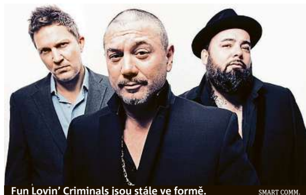
Fun Lovin' Criminals jsou stále ve formě.