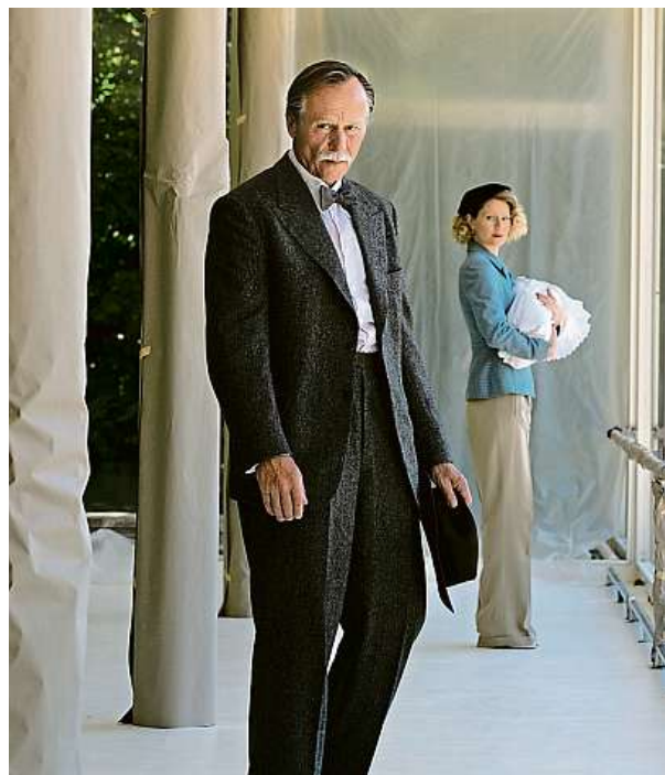
Ve filmu hraje Karel Roden.

Film Skleněný pokoj byl natočen podle světoznámého bestselleru Simona Mawera, inspirovaného vznikem architektonického skvostu – brněnské vily Tugendhat. Také spisovatel Simon Mawer přislíbil účast na brněnské premiéře. Do kin po celé republice vstupuje Skleněný pokoj ve čtvrtek.