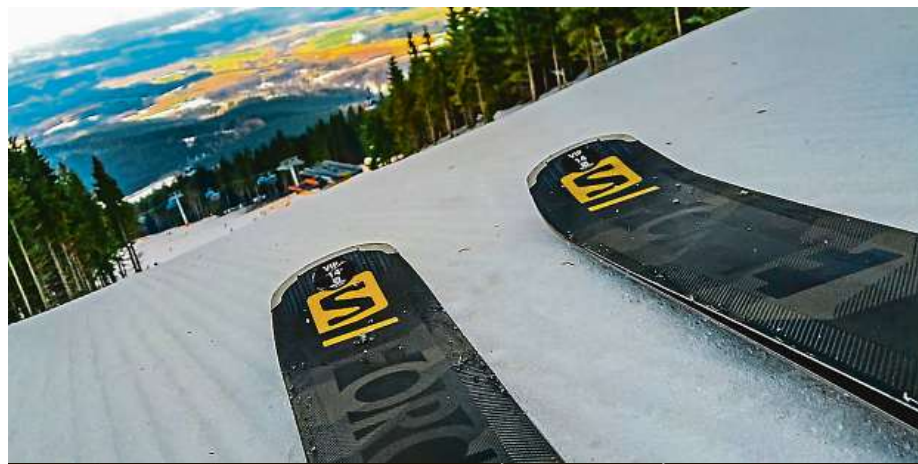
Vyzkoušeli jsme v předstihu lyže pro sezonu 2019/2020 Salomon S/Force.