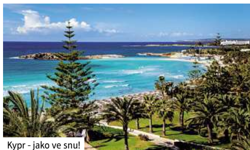
Kypr - jako ve snu!