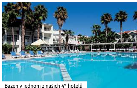
Bazén v jednom z našich 4* hotelů

Snídaně. Dnes jedeme do hlavního města Nicosie, známé poslední hlavní město přes které prochází hranice mezi dvěma státy. Máte možnost vidět osmanské pozůstatky karavanseraje s nádherným nádvořím. Po obědě (není v ceně zájezdu), máte možnost