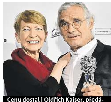
Cenu dostal i Oldřich Kaiser, předá-

Při udělování filmových cen uspěl snímek Bohdana Slámy.