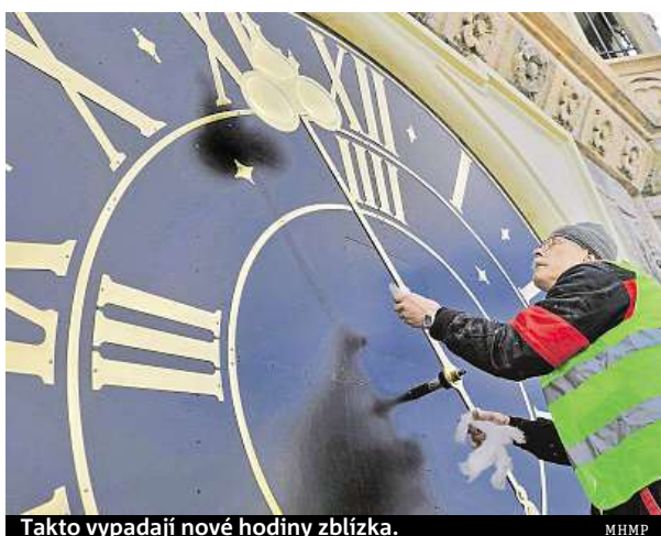
Takto vypadají nové hodiny zblízka. MHMP

„Staroměstská radnice získala spolu s původní podobou ciferníků hodin na věži nepřehlédnutelnou část svojí