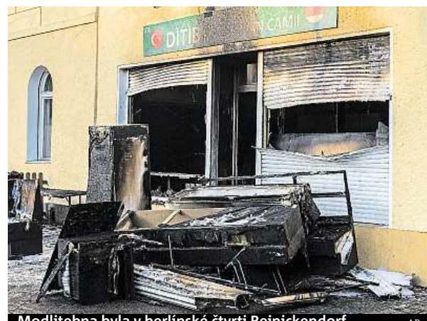
Modlitebna byla v berlínské čtvrti Reinickendorf.

Mešitu v Reinickendorfu provozuje vlivná muslimská organizace Ditib, která zastřešuje činnost asi devíti set islámských spolků v Německu, v nichž se sdružují hlavně