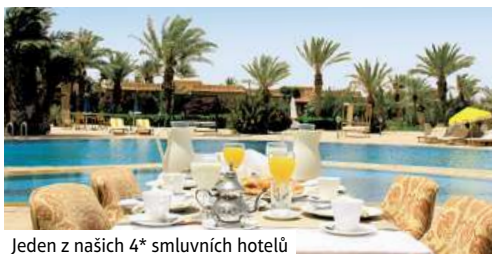
Jeden z našich 4* smluvních hotelů