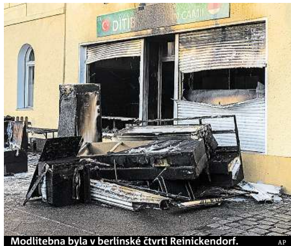
Modlitebna byla v berlínské čtvrti Reinickendorf.

Mešitu v Reinickendorfu provozuje vlivná muslimská organizace Ditim, která zastřešuje činnost asi devíti set islámských spolků v Německu, v nichž se sdružují hlavně příslušníci místní turecké menšiny. Za úto-