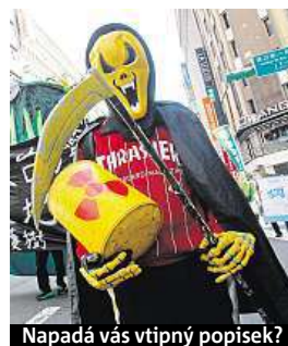
Napadá vás vtipný popisek?

Napište bublinu a reagujte na sloupek na: www.facebook.com/denikmetro