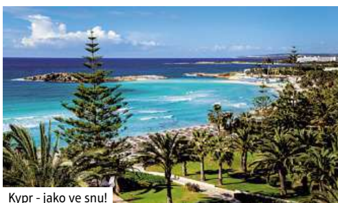
Kypr - jako ve snu!

1. den: Let na Kypr (Při objednaném balíčku transportů) Let do Ercanu. Naše průvodkyně Vás přivítá při odchodu z letiště a dopravíte se do 4* hotelu Riverside Premium v okolí Kyrenie.