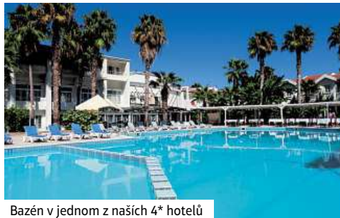
Bazén v jednom z našich 4* hotelů

Snídaně. Dnes jedeme do hlavního města Nicosie, známé poslední hlavní město přes které prochází hranice mezi dvěma státy. Máte možnost vidět osmanské pozůstatky karavanseraje s nádherným nádvořím. Po obědě (není v ceně zájezdu), máte možnost