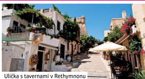
Ulička s tavernami v Rethymnonu