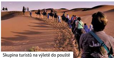
Skupina turistů na výletě do pouště

Snídaně. Čeká nás jízda přes Střední Atlas, přes Azru a nádhernými cedrovými a borovicovými lesy do města Meknes. V pozdních odpoledních hodinách přijedeme do královského města Meknes. Kontrastem minulosti a současnosti je právě město Meknes. Především oblast s ruinami a uličky Medína. Další místo naší procházky je vodní nádrž a středověké stáje. Přenocování v Meknes.