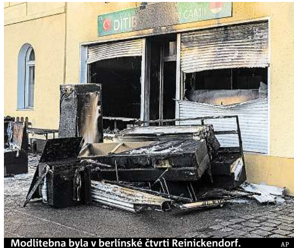
Modlitebna byla v berlínské čtvrti Reinickendorf.

Mešitu v Reinickendorfu provozuje vlivná muslimská organizace Ditim, která zastřešuje činnost asi devíti set islámských spolků v Německu, v nichž se sdružují hlavně příslušníci místní turecké menšiny. Za úto-