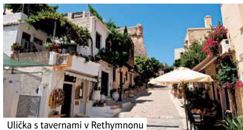
Ulička s tavernami v Rethymnonu