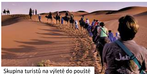
Skupina turistů na výletě do pouště

Snídaně. Čeká nás jízda přes Střední Atlas, přes Azru a nádhernými cedrovými a borovicovými lesy do města Meknes. V pozdních odpoledních hodinách přijedeme do královského města Meknes. Kontrastem minulosti a současnosti je právě město Meknes. Především oblast s ruinami a uličky Medína. Další místo naší procházky je vodní nádrž a středověké stáje. Přenocování v Meknes.