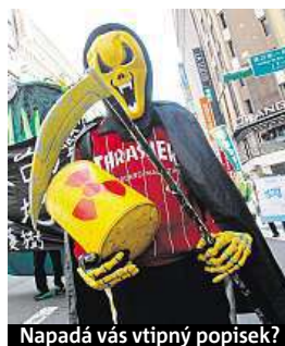
Napadá vás vtipný popisek?

Napište bublinu a reagujte na sloupek na: www.facebook.com/denikmetro