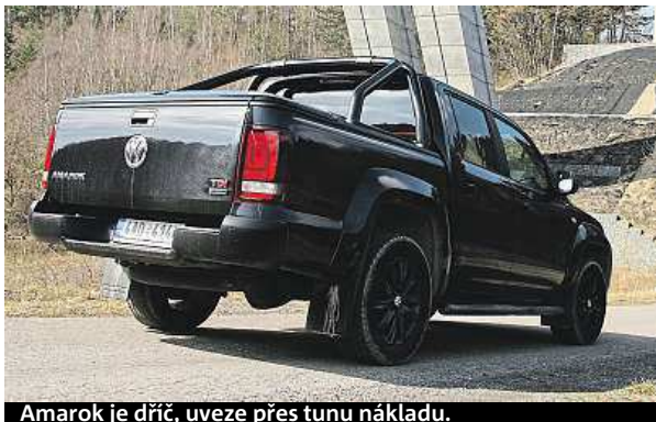
Amarok je dřič, uveze přes tunu nákladu.

ka potrápít na legální offroadové trati. A nelekl se toho. Auto zvládlo vybruslit z kluzké jámy stejně lehce jako přeskocit haldu sypké hlíny. Pud sebezáchovy nedovolil amaroka prohnat mělkým potokem s kameny, přece jen neměl offroadové pneumatiky a nechtěli jsme pomáchat boční ochranné lišty a černé osmnáctipalcové disky. Do kolonky terén na vysvědčení ale píšeme za jedna. Amarok má normálně pohon zadních kol, můžete však