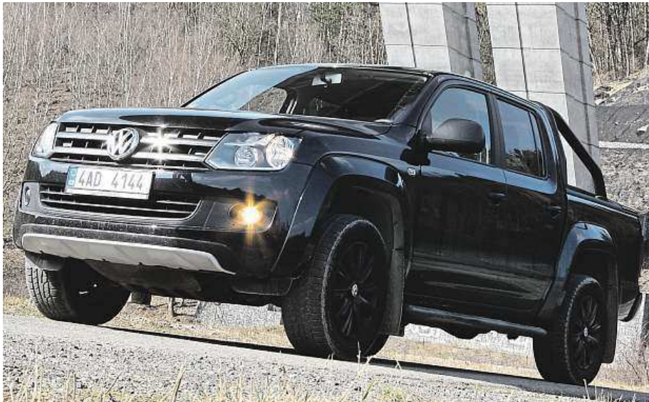
Nekompromisně se tváří amarok v edici Dark Label

Amarok je všestranné auto, třebaže jeho původ odkazuje na venkovské pracovní užítka. Díky své vizáži a schopnosti bravurně zvládat běžný provoz může být nejen autem pro těžce pracující lid, ale i pro městského člověka, který si občas udělá výlet do terénu. Edici Dark Label, která je černá jak noc, jsme už měli možnost vyzkoušet loni, teď jsme ale chtěli vydesigovaného flout-