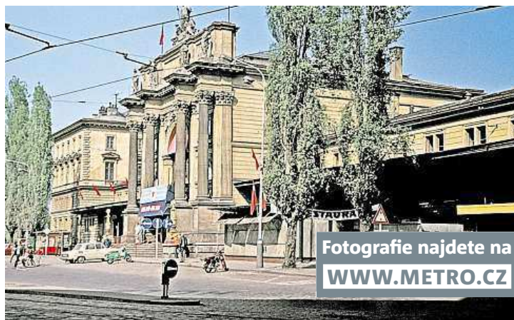
Fotografie najdete na WWW.METRO.CZ