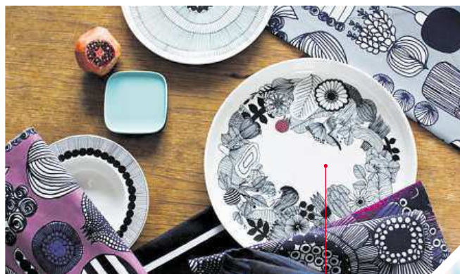
Marimekko, založená v roce 1951, je finská textilní a oděvní společnost známá svými originálními potisky a barvami. Navrhuje a vyrábí kvalitní interiérové dekorativní předměty od potahových textilií po prostírání, stejně jako oblečení, tašky a další doplňky.