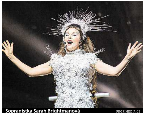
Sopranistka Sarah Brightmanová

„Zpívat ve stavu beztíže je velmi odlišné od toho stát pevněma nohama na zemi. Snažím se tedy najít skladbu, která bude krásná a s jasným sdělením, ale ne příliš komplikovaná na zpěv,“ řekla Brightmanová novinářům, když v Londýně tento zajímavý projekt oznamovala. Další hudební talenty by měly její