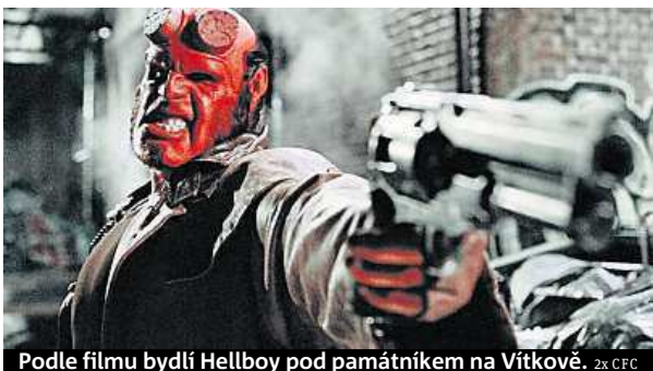
Podle filmu bydlí Hellboy pod památkem na Vítkově. 2x CFC

„Záměrem letošního projektu na podporu domácího cestovního ruchu je zdůraznit propojení metropole s filmovou kulturou a pozvat Čechy nejen do pražských kin, ale i na filmové festivaly, výstavy nebo do barrandovských ateliérů,“ vysvětluje ředitelka Prague City Tourism Nora Dolanská.