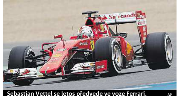
Sebastian Vettel se letos předvede ve voze Ferrari.

Fernando Alonso z McLarenu, který měl před třemi týd-