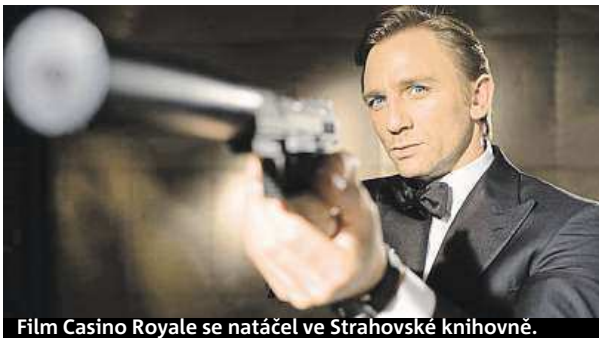
Film Casino Royale se natáčel ve Strahovské knihovně.

U Stavovského divadla si mohou návštěvníci zavzpomínat na Amadea, ve Strahovském klášteře na Jamese Bonda, připomínat se budou ale i slavné české filmy. Třeba Fišerovo knihkupectví v Kaprově ulici si zahrálo v komedii Vrchní, prchni, ve Francouzské restauraci Obecního domu obsluhoval číšník Jan Dítě anglického krále.