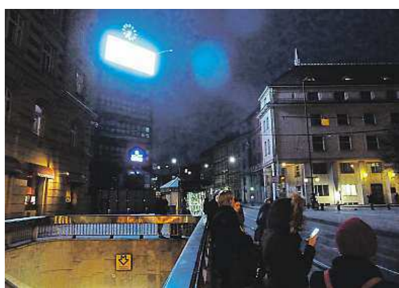
Jak na světelné znečištění

Palackého náměstí (na snímku) není jediným místem, na kterém v noci září světelná reklama. Jak se jí brání?