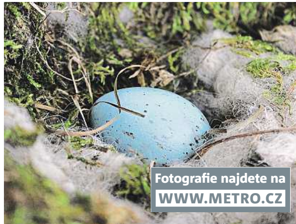
Fotografie najdete na WWW.METRO.CZ