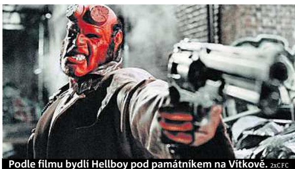
Podle filmu bydlí Hellboy pod památkem na Vítkově. 2x/CFC

„Záměrem letošního projektu na podporu domácího cestovního ruchu je zdůraznit propojení metropole s filmovou kulturou a pozvat Čechy nejen do pražských kin, ale i na filmové festivaly, výstavy nebo do barrandovských ateliérů,“ vysvětluje ředitelka Prague City Tourism Nora Dolanská.