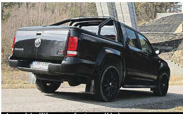
Amarok je dřič, uveze přes tunu nákladu.

ka potrápít na legální offroadové trati. A nelekl se toho. Auto zvládlo vybruslit z kluzké jámy stejně lehce jako přeskóčit haldu sypké hlíny. Pud sebezáchovy nedovolil amaroka prohnat mělkým potokem s kameny, přece jen neměl offroadové pneumatiky a nechtěli jsme pomácat boční ochranné lišty a černé osmnáctipalcové disky. Do kolonky terén na vysvědčení ale píšeme za jedna. Amarok má normální pohon zadních kol, můžete však