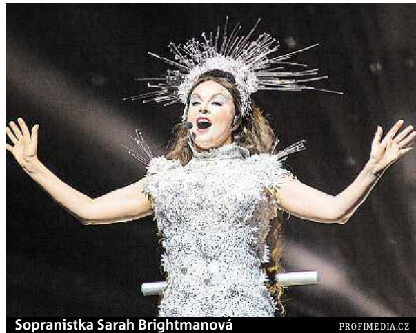
Sopránistka Sarah Brightmanová

Čtyřiapadesátiletá sopránistka prý už od šedesátých let snila o tom, že by se jednou chtěla do vesmíru podívat. Na Mezinárodní vesmírnou stanici ISS vyletí 1. září a zůstane na ní deset dní. Splnění jejího přání ale předchází tvrdý trénink, který již od loňského září podstupuje v Moskvě. „Trénink je náročný. V šest hodin ráno začínáme, následují přednášky, čtyři hodiny ruštiny, ale také trénujeme psychiku či přežití,