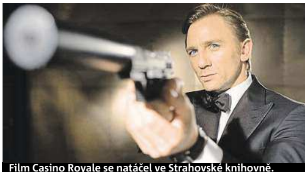
Film Casino Royale se natáčel ve Strahovské knihovně.

U Stavovského divadla si mohou návštěvníci zavzpomínat na Amadea, ve Strahovském klášteře na Jamese Bonda, připomínat se budou ale i slavné české filmy. Třeba Fišerovo knihkupectví v Kaprově ulici si zahrálo v komedii Vrchní, prchni, ve Francouzské restauraci Obecního domu obsluhoval číšník Jan Dítě anglického krále.