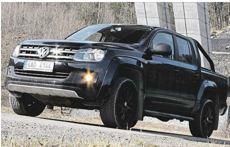
Nekompromisně se tváří amarok v edici Dark Label

Amarok je všestranné auto, třebaže jeho původ odkazuje na venkovské pracovní užítka. Díky své vizáži a schopnosti bravurně zvládat běžný provoz může být nejen autem pro těžce pracující lid, ale i pro městského člověka, který si občas udělá výlet do terénu. Edici Dark Label, která je černá jak noc, jsme už měli možnost vyzkoušet loni, teď jsme ale chtěli vydesignovaného flout-