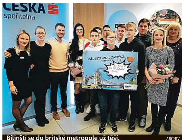
Bělinští se do britské metropole už těší.

S úkoly se pod vedením učitelky Jarmily Kabourkové popasovala nejen desítka deváťáků z týmu. I soutěž pro jed-