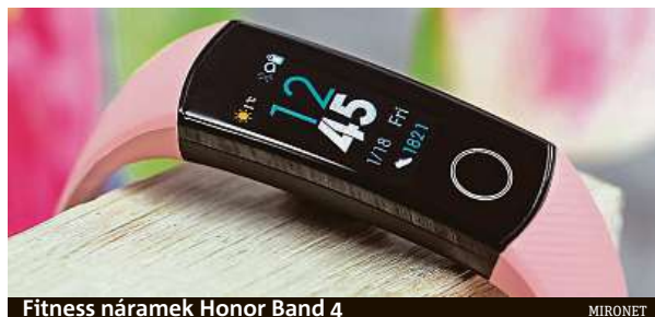
Fitness náramek Honor Band 4

S telefonem se náramek propojí pomocí bluetooth a poté průběžně synchronizuje data s mobilní aplikací. Údaje o svých sportovních aktivitách má tedy nositel zaří-