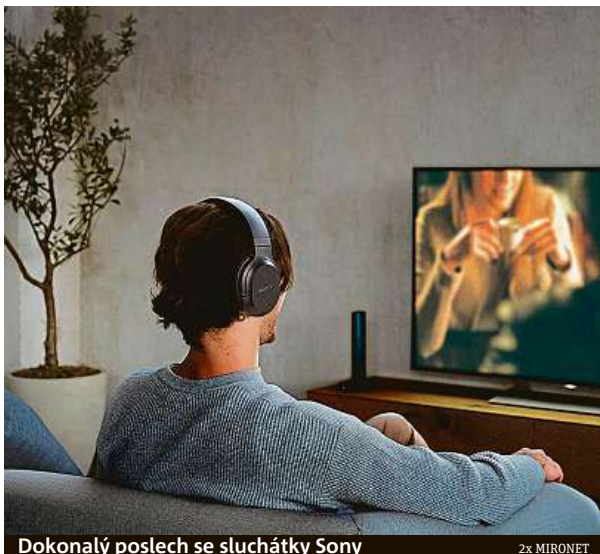
Dokonalý poslech se sluchátky Sony

S chytře navrženými náhlavními sluchátky váš poslech nenaruší ani hluk z ulice, ani ostatní členové domácnosti. Jak sluchátka vybrat? Pro poslech v domácích podmínkách jsou nejlepší volbou náhlavní bezdrátová sluchátka s externím vysílačem. S nimi se vám dostane vysoké kvality produkovaného zvuku, perfektní izolace okolního hluku, výborného dosahu a minimálního rušení signálu. Aktuálně tomuto odvětví kralují sluchátka Sony