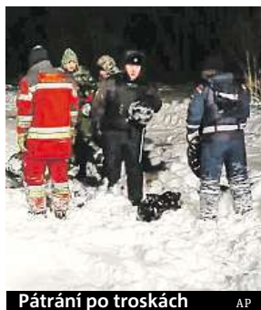
Pátrání po troskách AP

dem šlehal plameny a ozvala se exploze. Trosky stroje jsou rozeté na kilometr dlouhém pásu. Mezi oběťmi jsou podle ruského ministerstva pro výjimečné záležitosti i dvě děti ve věku pět a 12 let, jedna 17letá osoba a jeden cestující ze Švýcarska a jeden z Ázerbájdžánu. Na palubě byli tři cizinci. České ministerstvo zahraničí sdělilo, že nemá informace, že by mezi oběťmi byl český občan. ČTK