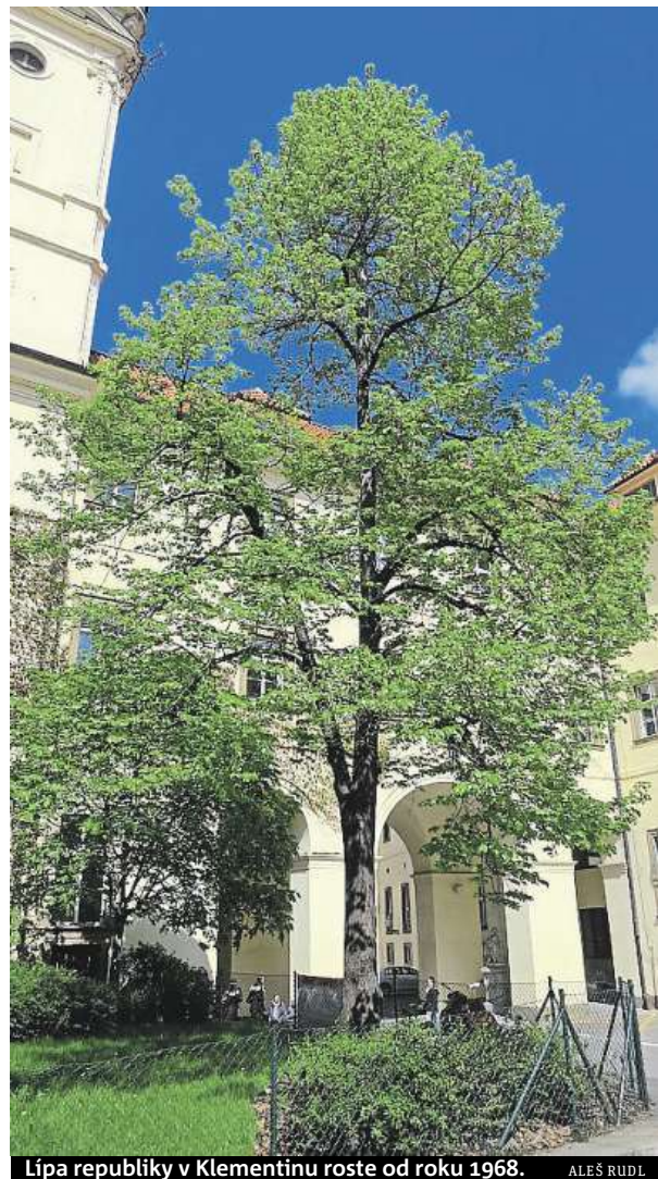
Lipa republiky v Klementinu roste od roku 1968. ALEŠ RUDL

fon a vyrazit do přírody vyfotit nejbližší dendrologický symbol české státnosti – lípu, a o svůj objev se následně po-