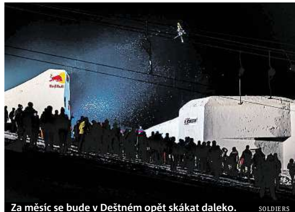
Za měsíc se bude v Deštném opět skákat daleko. SOLDIERS

Akce se pravidelně účastní top světoví jezdci z Evropy i ze zámoří. V předchozích letech se na startovní listině Soldiers objevili účastníci olympijských her i X-Games. Stejně by tomu mělo být i letos. Termín konání závodu je totiž stanoven tak, aby se stihli oslovit všichni světoví jez-