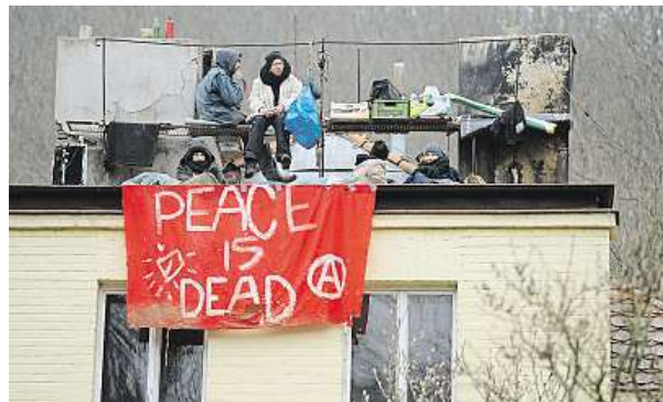
Víc než desítky squaterů obsadila objekt v pátek večer. ČTK

Desítky squaterů, která v pátek večer obsadila usedlost Šatovka v Šáreckém údolí, hrozí vězení. Policisté původně označili jednání aktivistů za přestupek, poté ale zahájili trestní řízení. Nikoho však zatím nestíhají. Nadále také platí původní rozhodnutí, že policie proti squaterům na střeše budovy z bezpečnostních důvodů nezasáhne. Zástupce squaterů řekl, že dům neopustí, dokud nebudou mít záruku, že nebudou zatčeni. Člověku, který neoprávněně obsadí cizí dům, hrozí podle zákona pokuta nebo až dva roky vězení. Za mimořádných okolností – pokud vznikne velká škoda, nebo čin spáchá organizovaná skupina – může trest činit až pět let vězení.