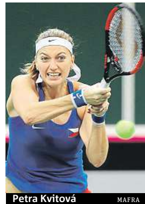
Petra Kvitová MAFRA

V dubnovém semifinále Česky pociestují na půdu tenistek Německa. ČTK