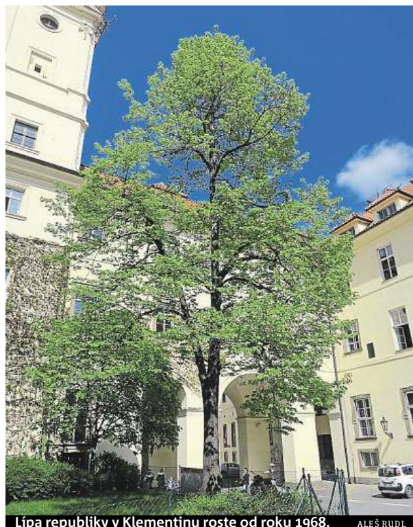
Lípa republiky v Klementinu roste od roku 1968.

voj dopravy a rozšiřování komunikací. Jejich ztrátou se ochuzujeme o živé svědky naší národní historie,“ dodává iniciátor projektu a dendrolog Aleš Rudl. Sazení stromů při významných událostech má u nás dlouhou tradici. FILIP JAROŠEVSKÝ