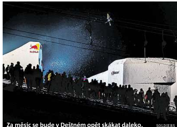
Za měsíc se bude v Deštném opět skákat daleko.

Akce se pravidelně účastní top světoví jezdci z Evropy i ze zámoří. V předchozích letech se na startovní listině Soldiers objevili účastníci olympijských her i X-Games. Stejně by tomu mělo být i letos. Termín konání závodu je totiž stanoven tak, aby se stihli oslovit všichni světoví jez-