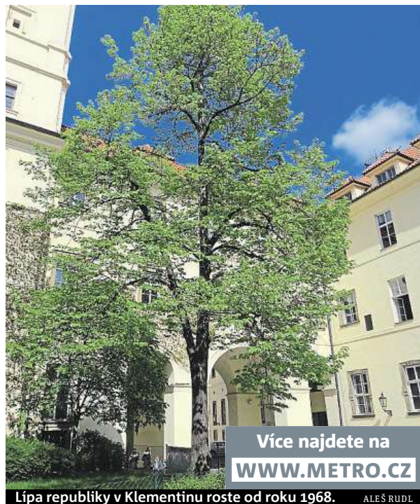
Lípa republiky v Klementinu roste od roku 1968.