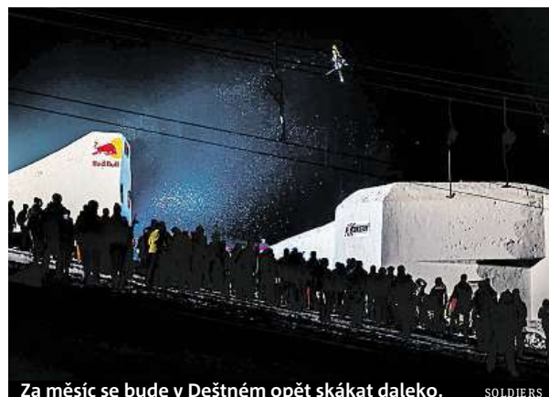
Za měsíc se bude v Deštném opět skákat daleko. SOLDIERS

Akce se pravidelně účastní top světoví jezdci z Evropy i ze zámoří. V předchozích letech se na startovní listině Soldiers objevili účastníci olympijských her i X-Games. Stejně by tomu mělo být i letos. Termín konání závodu je totiž stanoven tak, aby se stihli oslovit všichni světoví jez-