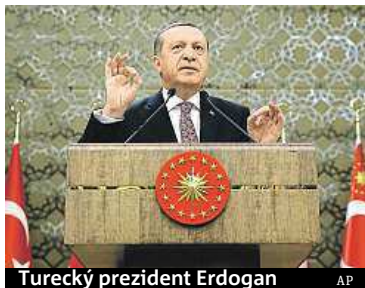
Turecký prezident Erdogan

„Můžeme kdykoli otevřít brány do Řecka a Bulharska a posadit uprchlíky do autobusů. Jak se s uprchlíky vyporádáte, když nebude žádná dohoda? Zabijete je?“ řekl údajně unijním vůdcům Erdogan. V Turecku se nyní nachází již více než 2,6 milionu syrských uprchlíků. Podle záznamu ze schůzky si měl Erdogan říci o šest miliard eur na řešení uprchlické krize. To je dvakrát více, než zatím přislíbila Evropská unie. Prezident také nabá-