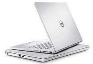
Dell Inspiron 15 7000 MIRONET

Na grafické aplikace a aktuální herní pecky je připravena vyšlápnutou si grafická karta NVIDIA GTX 960M s plýmy 4 GB paměti. Nechybí podsvícená klávesnice a nejvyšší operační systém Windows 10. S dvouletou next business day zárukou přijde technik do druhého dne až k vám domů a vše vyřeší.