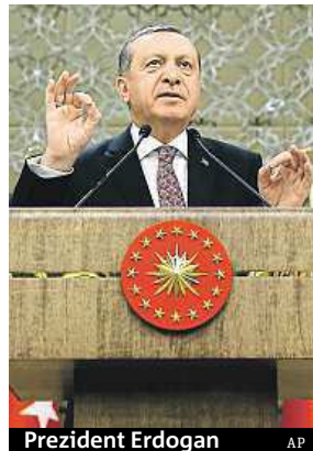
Prezident Erdogan

Podobně to řekl už na schůzce k řešení uprchlické krize šéfovi Evropské komise Jeanu-Claudu Junckerovi a předsedovi Evropské rady Donaldu Tuskovi. Toto velmi vypjaté setkání se ovšem odehrálo už v listopadu. „Můžeme kdykoli otevřít brány do