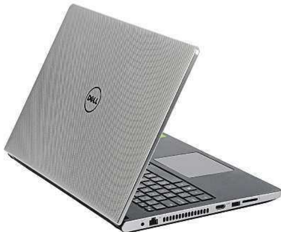
Sikovní notebook Dell Inspiron 15 5000

Pod skvěle padnoucím designovým kabátkem se ukrývá nadupaný dvoujádrový procesor Intel Core i5-6200U, postavený na nejkročičejší architektuře Skylake, taktovaný na 2.3 GHz