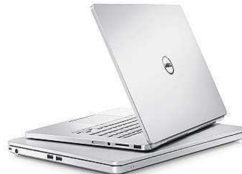
Dell Inspiron 15 7000