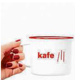
Logo trojky na hrnku P3

Praha 6 mění vizuální podobu své komunikace. Jednotný styl vzejde z designérské soutěže.