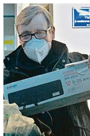
Rath z vězení s krabicí. Byl v dobré náladě.