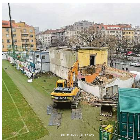
BOHEMIANS PRAHA 1905