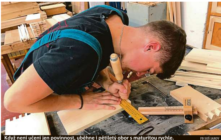
Když není učení jen povinnost, uběhne i pětiletý obor s maturitou rychle.

Nabídka středních škol je široká, k užšímu výběru se žáci dostanou po zodpověze-