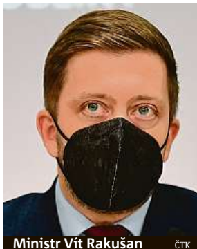
Ministr Vít Rakušan

Kolem nejvýznamnější české památky se vytvořilo válečné opevnění. „Uděláme revizi,“ říká ministr.