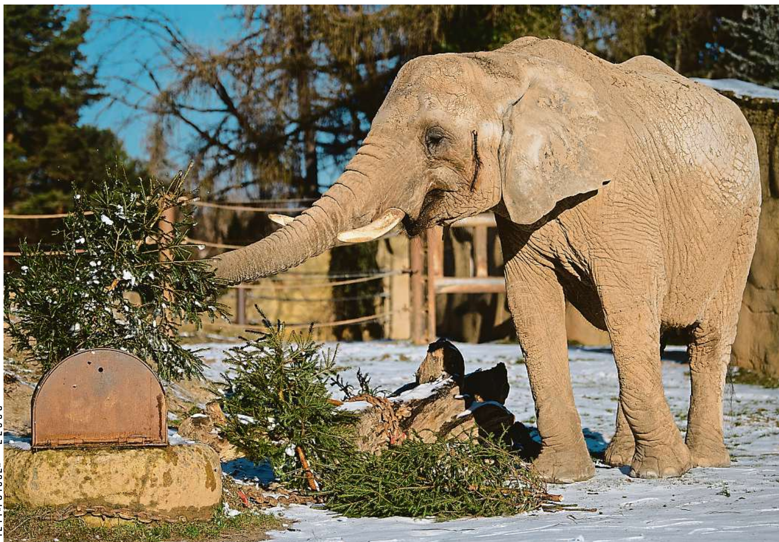
Sloni v zoo ve Dvoře Králové měli včera zelenou hostinu. Chovatelé jim do výběhu naservírovali nepoužité vánoční stromky.

Přihlášky. Do konce února se musí žáci devátých tříd rozhodnout, na jakou střední chtějí. Klíčová volba. Typ školy by měl odpovídat zájmům dítěte. Osobní návštěva. Využijte dny otevřených dveří STRANA 10