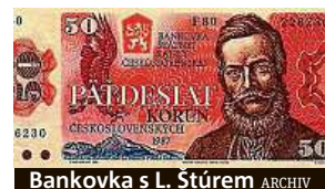
Bankovka s L. Štúrem

Z bankovky uvedené roku 1987 hledí Ludovít Štúr, bez něž by nebylo spisovné slovenštiny vytvořené v roce 1843 ze středoslovenských nářečí. Štúr byl rusofil, podporoval pravoslaví a netajil se antisemitismem. Jeho život zhasl 12. ledna 1856, kdy se nešťastně postřelil na lovu. HAL