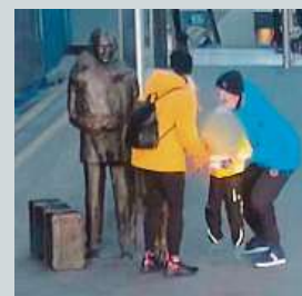
Záznam z kamery

Socha zachránce židovských dětí Nicholase Wintona na hlavním nádraží má opět poškozené brýle. Policisté v souvislosti s tím hledají muže a ženu, kteří 30. prosince odpoledne podle kamerového záznamu vyzvedli k hlavě sochy malé dítě.