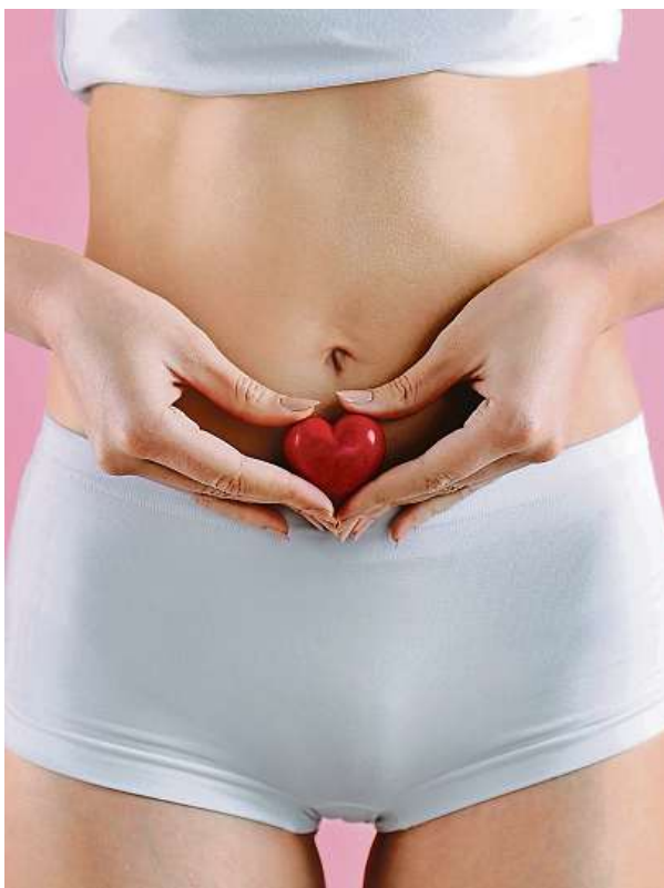
Ženy, neodbyvejte se a chodte na gynekologii!

Lidské papilomaviry jsou nejčastější sexuálně přenosnou infekcí, během života se