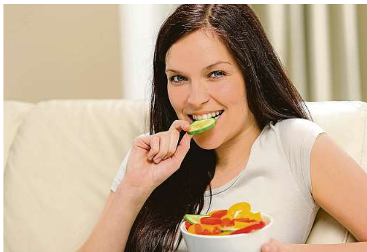
Zdravá strava pomůže, nejen diabetikům, k lepší imunitě.