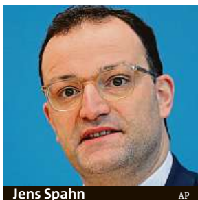
Jens Spahn

Za hranicemi máme premianta očkování proti koronaviru.