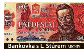
Bankovka s L. Štúrem

Z bankovky uvedené roku 1987 hledí Ludovít Štúr, bez nějž by nebylo spisovné slovenštiny vytvořené v roce 1843 ze středoslovenských nářečí. Štúr byl rusofil, podporoval pravoslaví a netajil se antisemitismem. Jeho život zhasl 12. ledna 1856, kdy se nešťastně postřelil na lovu. HAL