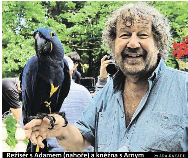
Režisér s Adamem (nahore) a kněžna s Arnym 2x ARA-KAKADU

Ara Erik je velmi stabilní šestiletý samec, který je