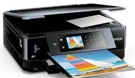
Tiskárna od společnosti Epson

Akce typu cash-back mají Češi v oblíbě, což samozřejmě vědí i výrobci elektroniky, kteří se tímto způsobem snaží svým zákazníkům příjemně nakupování.