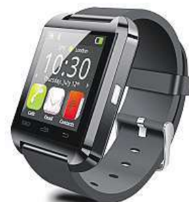
Aliigator EW03 MIRONET

pohybu a pitného režimu. Samozřejmě vás neochudí ani o notifikace příchozích SMS, hovorů či oznámení ze sociálních sítí, jež vám pohodlně zobrazí přímo na displeji. Díky zabudovanému reproduktoru a mikrofonu navíc můžete hovor ihned přijmout a využít hodinky jako handsfree. Aliigator EW03 propojíte prostřednictvím bluetooth s telefonem s operačním systémem Android a iOS.