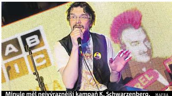
Minule měl nejvýraznější kampaň K. Schwarzenberg. MAIRA

Přibýly televize, duely a sociální sítě. Česko zažilo trochu jinou prezidentskou kampaň.