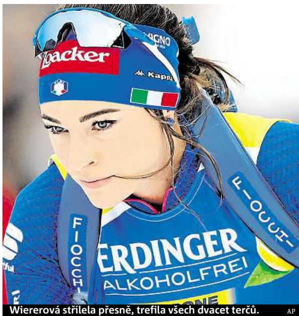
Wiererová střelila přesně, trefila všech dvacet terčů.