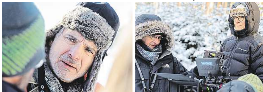
Oldřich Kaiser (vlevo) se štábem Jana Svěráka (vpravo) chtěli pravý sníh.