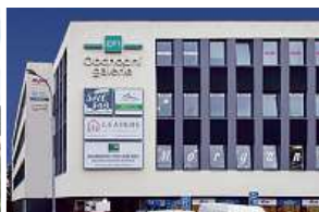
Obchodní galerie, Jihlava