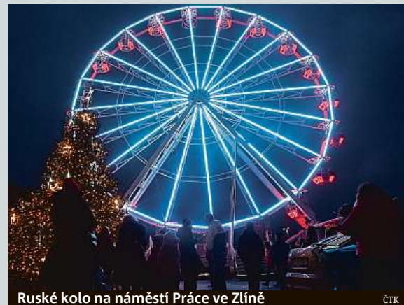
Ruské kolo na náměstí Práce ve Zlíně