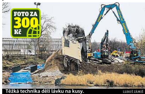
Těžká technika dělí lávku na kusy.

o víkendu. Technická správa komunikací od něj nečeká žádné překvapivé výsledky, poslední zkoušky má z loňského roku. Výsledky nových použije pro přípravu projektové dokumentace pro opravu soumostí a přípravu stavebního povolení. Rekonstrukci musí projednat také s památkáři, protože mosty jsou památkově chráněné. Měření ale komplikovalo dopravu. V každém směru byl uzavřen jeden jízdní pruh a na magistrále se tvořily kolony. ČTK