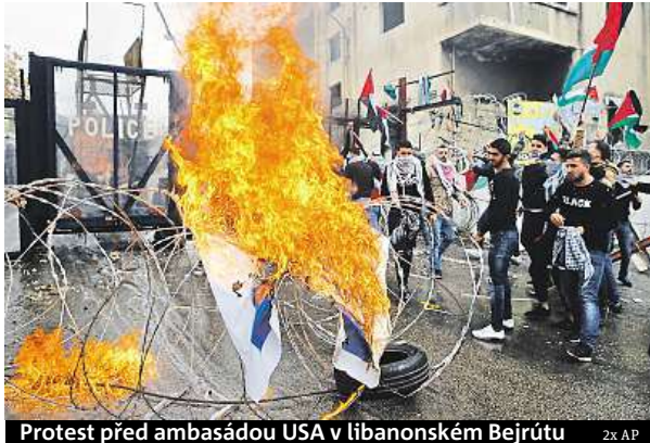
Protest před ambasadou USA v libanonském Bejrútu

Ve městě panuje od minulého týdne napětí kvůli oznámení amerického prezidenta Donalda Trumpa uznat Je-