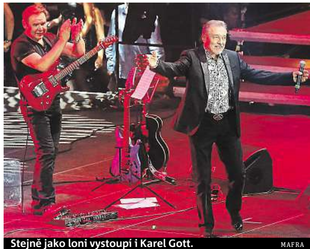
Stejně jako loni vystoupí i Karel Gott.