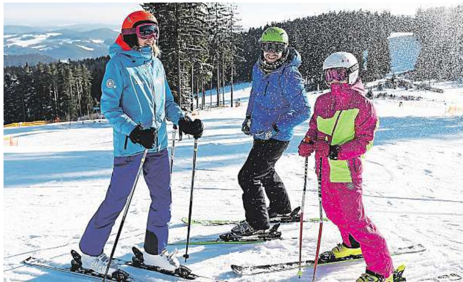
Víkendová paráda na Lipně.