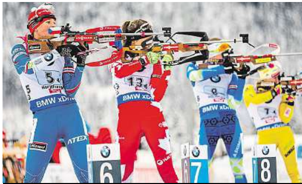
Biatlonistky se na střelnici potýkaly i s větrem. PETR SLAVÍK