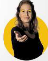
FAKULTA SOCIÁLNÍCH STUDIÍ/FSS