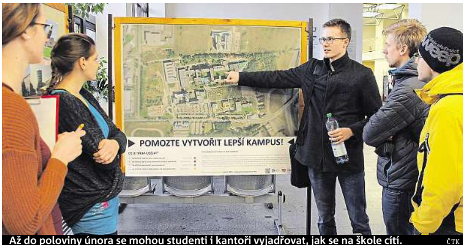
Až do poloviny února se mohou studenti i kantoři vyjadřovat, jak se na škole cítí. ČTK

Západočeská univerzita (ZČU) zahájila sběr dat pro takzvanou pocitovou mapu. Studenti i akademici se mohou až do poloviny února vyjádřit, která místa vnímají pozitivně a která naopak jako problémová, a přispět tak k tomu, aby se areál ZČU stal přívětivějším místem, řekla mluvčí Šárka Stará. Místa, kde je lidem v areálu kampusu příjemně, a kde ne, kam chodí rádi relaxovat a kde by měly nastat změny, mohou