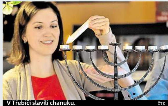
V Třebíči slavili chanuku.