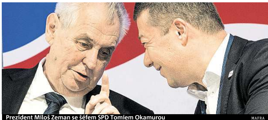
Prezident Miloš Zeman se šéfem SPD Tomiášem Okamurou

Hostem konference SPD byl prezident. Okamurovci mu vyjádřili nepřímo podporu v boji o Hrad.