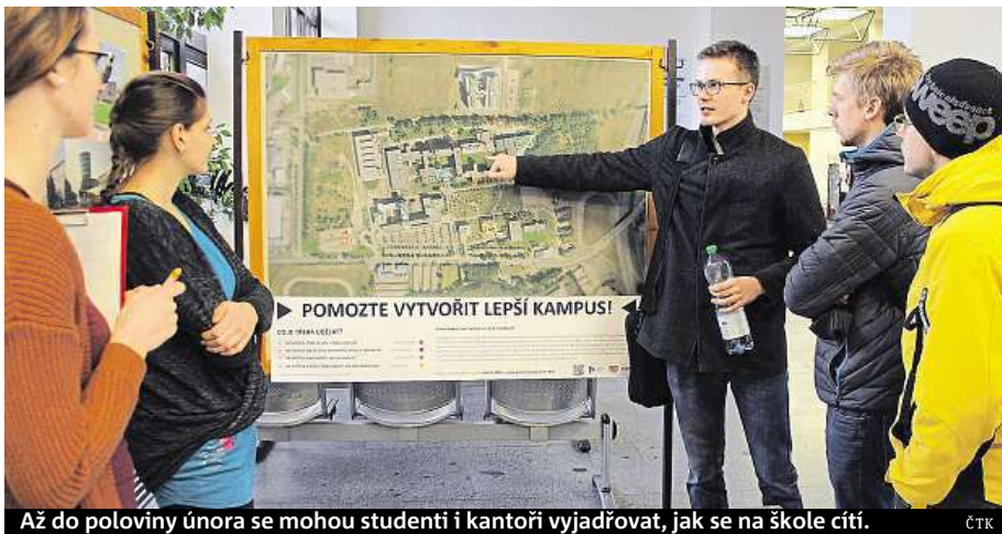
Až do poloviny února se mohou studenti i kantoři vyjadřovat, jak se na škole cítí.

Západočeská univerzita (ZČU) zahájila sběr dat pro takzvanou pocitovou mapu. Studenti i akademici se mohou až do poloviny února vyjádřit, která místa vnímají pozitivně a která naopak jako problémová, a přispět tak k tomu, aby se areál ZČU stal přívětivějším místem, řekla mluvčí Šárka Stará. Místa, kde je lidem v areálu kampusu příjemně, a kde ne, kam chodí rádi relaxovat a kde by měly nastat změny, mohou