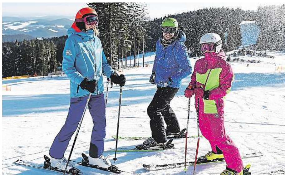
Víkendová paráda na Lipně.