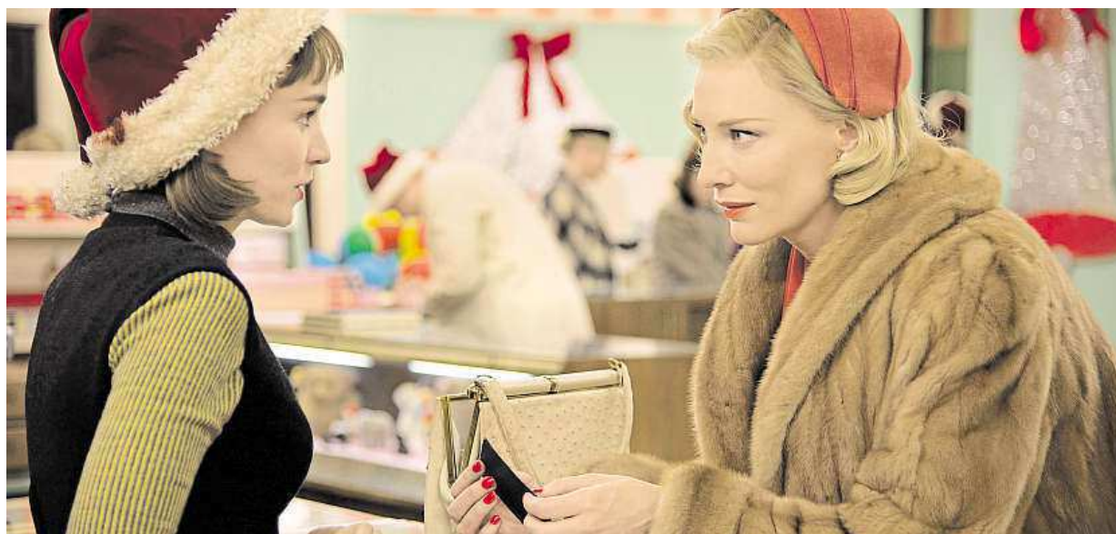
Nejvíce nominací na cenu Zlatý glóbus má lesbická romance Carol s Cate Blanchettovou a Rooney Maraovou. Více strana 6

Lékaři. Podle údajů nemocnice v Brně až každé páté dítě trpí oční poruchou. Vzdálenost. Děti mžourají na tablety příliš zblízka. Rady a tipy. Dítě by u displeje mělo strávit maximálně dvacet minut v kuse STRANA 4