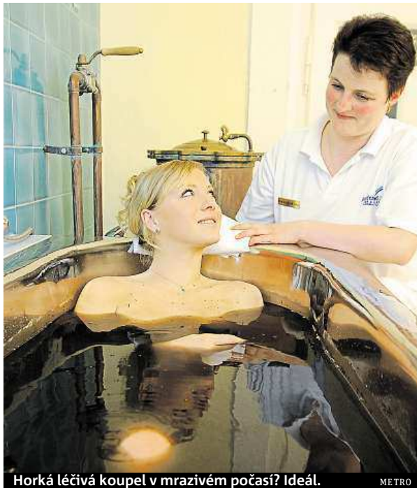
Horká léčivá koupel v mrazivém počasí? Ideál. METRO

Kdo si chce připadat jako v časech první republiky, neměl by si nechat ujít ubytování v zrekonstruovaném hotelu Centrální Lázně z roku 1892. Je tu velký balneoprovoz s 24 kabinami pro léčebné procedury. V nedalekých Nových Lázních si mohou návštěvníci vychutnat atmosféru původních Římských lázní s honosnými mramorovými sloupky. PETR HOLEČEK