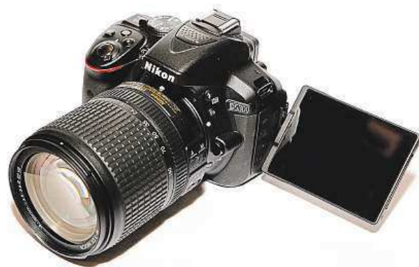
Fotoaparát Nikon D5300

Pokud patříte mezi fanoušky oblíbených HDR snímků, tedy fotografií s vysokým dynamickým rozsahem, díky spojení po sobě jdoucích obrázků, Nikon D5300 vám poskytne dostatečný prostor se vyřádit. Parádní kontrolu nad záběry pak poskytuje vy-