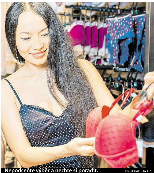
Nepodceňte výběr a nechte si poradit.

Právě tam je někdy problém, ukazuje se, že většina žen nezná svou správnou velikost podprsenky. Často tak celý život nosí volnější obvod a menší košíčky, než by pro ně bylo vhodné. Někdy může jít jen o estetiku, když prádlo správně nesedí, ale někdy mohou být následkem i zdravotní obtíže. „Mnohdy se v ordinaci při hledání důvodů, proč ženy trpí bolestmi zad, setkáváme s různými