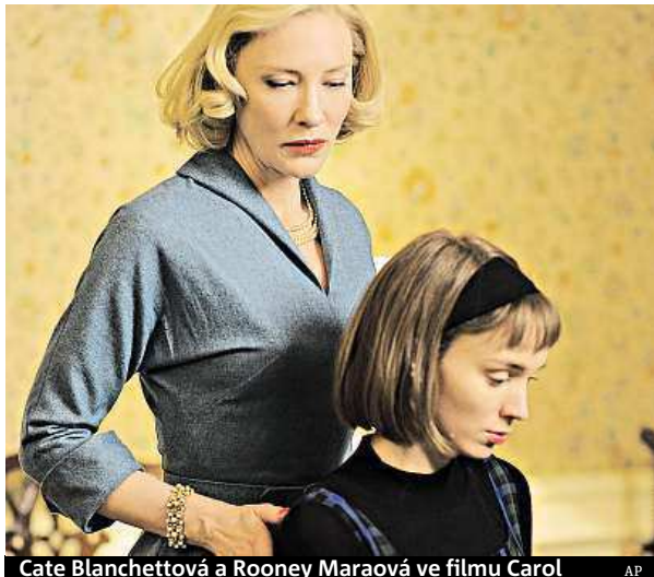
Cate Blanchettová a Rooney Maraová ve filmu Carol

O nominacích ve třicítce kategorií rozhodovalo přes devadesát členů Asociace zahraničních novinářů v Hollywoodu (HFPA). Nejvíce nominací na cenu Zlatý glóbus – pět – má lesbická romance Carol s Cate Blanchettovou a Rooney Maraovou. Horkým favoritem je také snímek Spotlight Thomase McCarthyho natočený podle skutečnosti a pojednávající o reportérech listu The Boston Globe, kteří se dlouhodobě věnovali problému zneužívání dětí v katolické církvi.