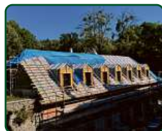
Zámek Račice, Račice-Pístovice - hájenka