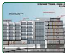
eFi Palace Hotel, Brno, 3. etapa, přístavba