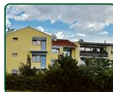
Bytový dům, Brno, ul. Holzova