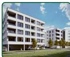
Bytové domy Břeclav, ul. Charvátská