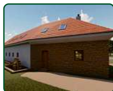
EFI Mlýn, EFI Motorest a rybníky - Hodonín u Kunštátu