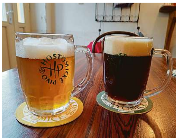
Hostomické pivo se stalo pro cestovatelky vítězem dne.