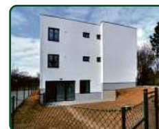
Rezidence Bílovice, Bílovice nad Svitavou

Již 21 let investujete s e-Finance, a.s.