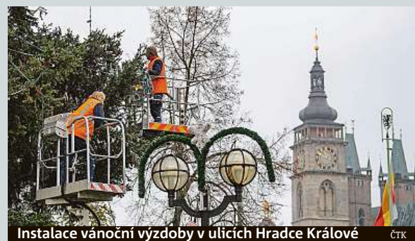
Instalace vánoční výzdoby v ulicích Hradce Králové ČTK

Při chemickém pokusu v základní škole ve Všerubech u Plzně se nadýchalo výparů pět dětí z prvního stupně školy a jedna učitelka. Na místo vyjeli hasiči, policie i záchranná služba. Sanitky je převezly do plzeňské fakultní nemocnice na pozorování. Nikdo z nich není v ohrožení života. Hasiči zjišťují, o jaké látky šlo, odborníci ze speciální laboratoře na místě nenaměřili žádné koncentrace nebezpečných látek. ČTK