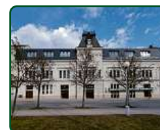
EFI SPA Hotel, Brno, Nám. 28. října