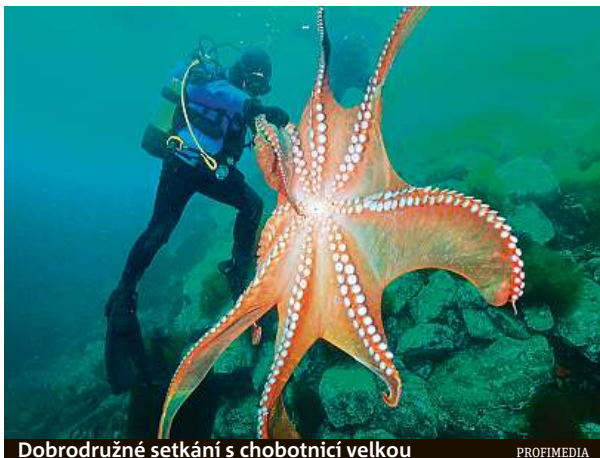
Dobrodružné setkání s chobotnicí velkou

Potápění v ledovém Pacifiku nahání husí kůži, voda má pochmurný, nazelenalý odstín. A do toho vás obeme chobotnice.