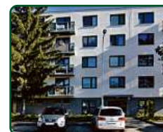
Rezidence Pěkná, Brno, nebytové prostory