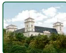
Zámek Račice, Račice-Pístovice - hl. budova