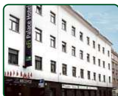
eFi Palace Hotel, Brno, dokončené 2 etapy