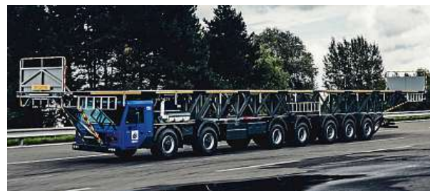
Pohon vzduchem odpružených náprav je 14 x 8. TATRA

V ostravské huti jezdí nejdelší vůz Tatra, jaký kdy byl postaven. Nové speciální vozidlo na převoz závitových tyčí dlouhých i přes 24 metrů slouží od října ve zkušebním provozu v areálu firmy Liberty Steel Ostrava, ocelárny, která je součástí nadnárodní skupiny GFG Alliance. Vůz je světovým unikátem, je to největší automobil Tatra v historii koprivnické automobilky. Speciální úpravy