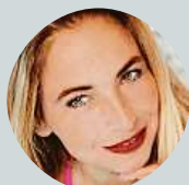
Ávina Stašina Nechápu, proč tak tlačí na pilu.

f Líbí se vám nová proticovidová kampaň?