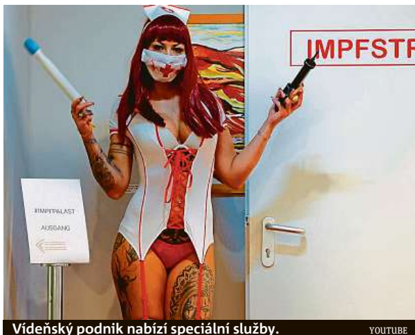
Vídeňský podnik nabízí speciální služby.

Úroveň proočkovanosti v Rakousku patří k nejhorším v západní Evropě. Plně naočkováno je 62,8 procenta obyvatel. Vláda z tohoto důvodu zavedla nová, přísnější opatření. Týkají se především právě lidí bez očkování proti covidu-19. Na řadě veřejných míst už není možné prokazovat se negativním testem. Vlá-