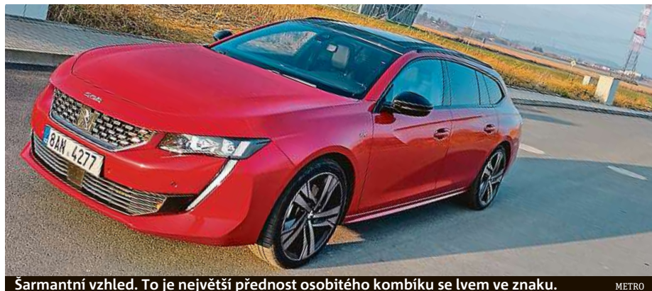
Sarmantní vzhled. To je největší přednost osobitého kombíku se lvem ve znaku. METRO

K testu jsme dostali nejsilnější model 508 SW, který je k máni. S klasickým motorem.