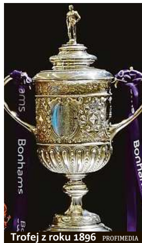
Trofej z roku 1896

V červenci roku 1871 navrhl Charles William Alcock, reportér listu The Sportsman, výboru Fotbalové asociace, že by bylo „žádoucí zřízení soutěžního poháru, ve kterém by se mohly utkat všechny týmy, jež náleží k asociaci“. První ročník poháru odstartoval v listopadu 1871 a po třinácti zápasech ho vyhrál londýnský klub Wanderers, který získal první titul 16. břez-