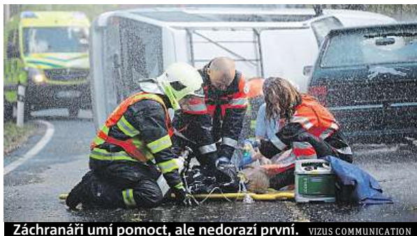
Záchranáři umí pomoci, ale nedorazí první. VIZUS COMMUNICATION

Taková situace na silnici není výjimečná. Podle evropského průzkumu jen třetina řidičů při nehodě pamatuje na své bezpečí – například si nezapomene obléct reflexní vestu. A jen polovina řidičů myslí na nutnost místo nehody řádně označit a zabezpečit. Problém českých řidičů je