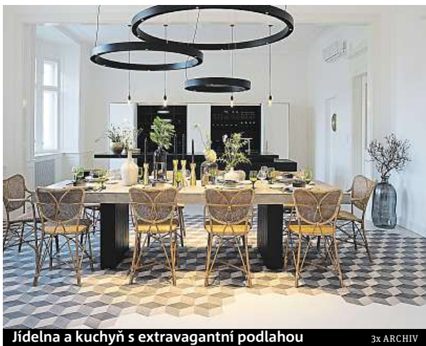
Jídelna a kuchyň s extravagantní podlahou