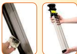
Filtry není třeba nikdy vyměňovat! Stačí je jen jednoduše vyjmout a otřít. Účinek filtrace ihned vidíte!

cena 3.490 Kč/ks cena 3.290 Kč/ks od 2 ks