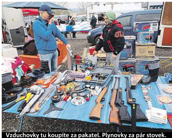
Vzduchovky tu koupíte za pakatel. Plynovky za pár stovek.