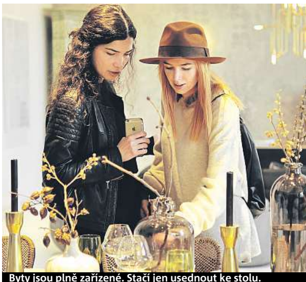
Byty jsou plně zařízené. Stačí jen usednout ke stolu.

kateli, kteří hodně cestují. Nechybí dvě koupelny, první pro muže a druhá pro ženu. Nejlepší a největší místností v bytě B je kuchyň s obývacím pokojem, které lze rozdělit skládacími dveřmi. Dalším atypickým prvkem je ku-