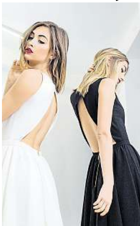
Prestižní škola módy ARCHIV

Ve studijním programu Produktový manažer pro módní marketing a design získají studenti znalosti z kultury módy a z produktové specializace (historie, trendy v módě atd.), dále z marketingu v módě (základy marketingu, přehled e-commerce atd.), ze všeob-