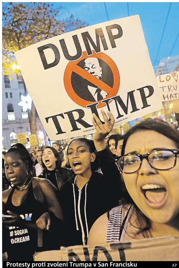
Protesty proti zvolení Trumpa v San Francisku

objevila i Lady Gaga. Popová hvězda během kampaně energicky podporovala Trumpovu protikandidátku Hillary Clintonovou. Podle CNN si demonstranti stěžují na Trumpův plán postavit zeď na hranicích s Mexikem a protestují proti jeho kampani, která rozdělila národ, i xenofobním výrokům, jež mnohé vyděsily. Další demonstrace se konaly ve Filadelfii, Bostonu, Portlandu, Austinu i jiných městech. V San Francisku už dříve protestovali studenti středních a vysokých škol. ČTK