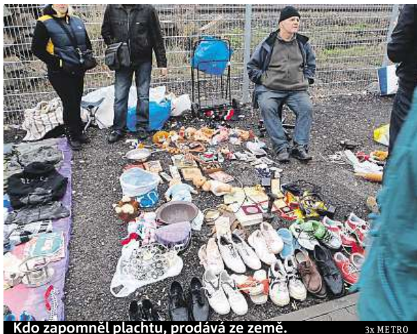
Kdo zapomněl plachtu, prodává ze země.