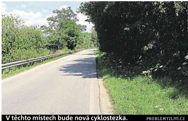
V těchto místech bude nová cyklostezka.

Trasa ve Zlivi bude mít jen 1,5 kilometru a prodraží se kvůli složitému místu. Názory, jestli pomůže, se různí.