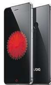
Nubia Z11 mini MIRONET

O tom, že Nubia Z11 mini není žádné ořezávátko, vás přesvědčí 8jádrový procesor Qualcomm doplněný grafickým čipem Adreno 405 a příjemnými 3 GB operační pa-