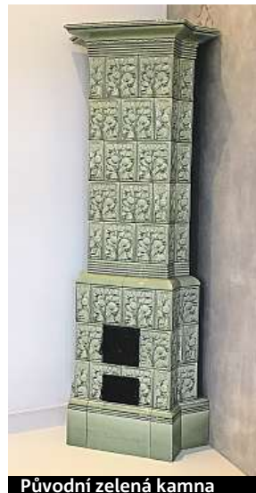
Původní zelená kamna