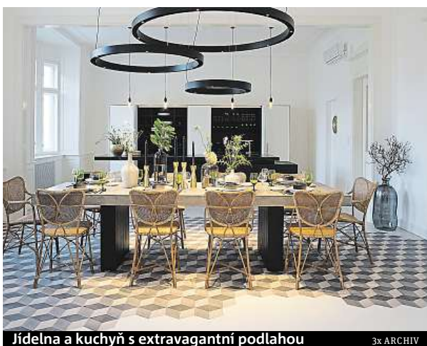
Jídelna a kuchyň s extravagantní podlahou