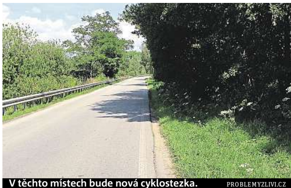
V těchto místech bude nová cyklostezka.

Trasa ve Zlivi bude mít jen 1,5 kilometru a prodraží se kvůli složitému místu. Názory, jestli pomůže, se různí.