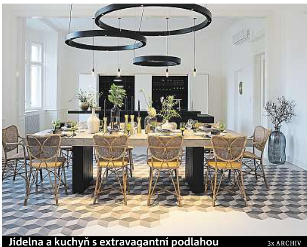
Jídelna a kuchyň s extravagantní podlahou