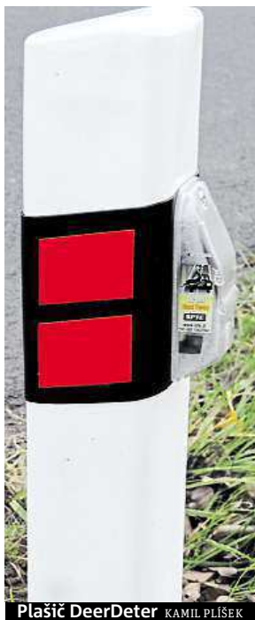
Plašič DeerDeter KAMIL PLÍŠEK

Přístroje se však nedají použít pro každou silnici. „Užití těchto zařízení není vhodné tam, kde vozidla tvoří souvislý proud, ale spíše na místech, kde jezdí samostatně s menší intenzitou,“ řekl Mar-