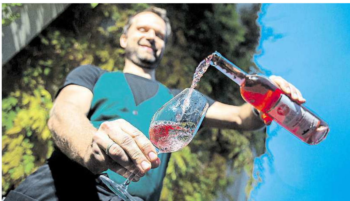
Je tu Svatomartinské

Svou mladistvou svěžest si Svatomartinská vína udrží až do Velikonoc, ale přes velký počet lahví bývají často vypítá ještě před Vánoce. Největší akce se koná jako každý rok v Brně pod názvem Svatomartinský košť. METRO