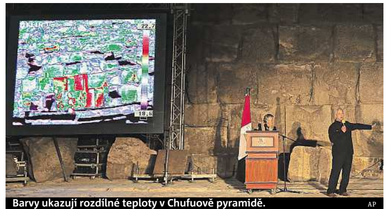
Barvy ukazují rozdílné teploty v Chufuově pyramidě.

Velké teplotní odchylky odhalil mezinárodní vědecký tým při skenování povrchu pyramid v egyptské Gíze.