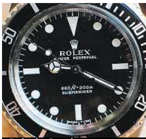
Rolexy Bonda

James Bond opět táhne. I jeho doplňky. Třeba hodinky z filmu Žít a nechat zemřít, co stojí devět milionů.