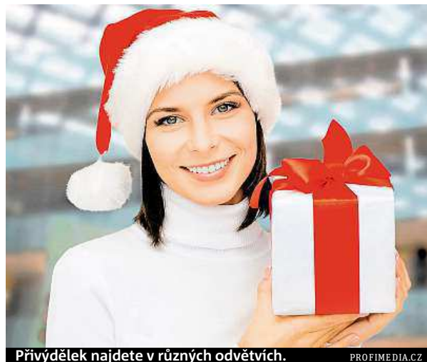
Přívýdělek najdete v různých odvětvích.

Nápor v předvánočním období je očekáván v gastronomii. Zvýšenou poptávku po brigádnících hlásí i bezpeč-