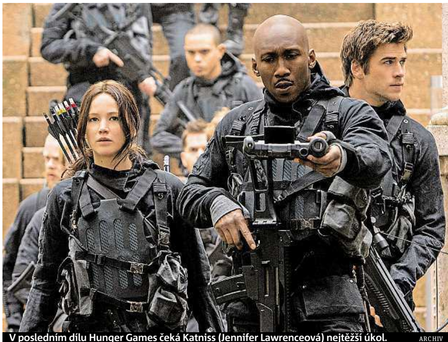
V posledním dílu Hunger Games čeká Katniss (Jennifer Lawrenceová) nejtěžší úkol.

Jednotka z 13. kraje se vydává na misi, jejímž cílem je zničit prezidenta a skoncovat s jeho tyranii. Na Katniss však tentokrát čeká mnohem nebezpečnější nepřítel, než s jakým se dosud kdy setkala v aréně. MET