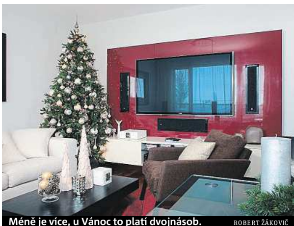
Méně je více, u Vánoc to platí dvojnásob.

„I když to tedy nemám rád, tak ano, obchodníci se každý rok vytasí s novými kolekcemi a kombinacemi. Hodně je nyní vidět klasika – tedy červená barva v kombinaci s dřevěnými dekoracemi,“ připouští Rendl a dodává, že v poslední letech jsou hodně oblíbené i zmrzlé ozdoby – tedy tlumené tóny barev a umělý sníh.