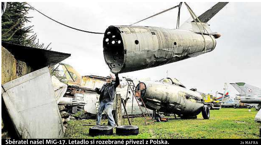
Sběratel našel MiG-17. Letadlo si rozebrané přivezl z Polska.