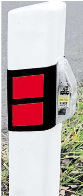
Plašič DeerDeter KAMIL PLÍŠEK

Přístroje se však nedají použít pro každou silnici. „Užití těchto zařízení není vhodné tam, kde vozidla tvoří souvislý proud, ale spíše na místech, kde jezdí samostatně s menší intenzitou,“ řekl Mar-