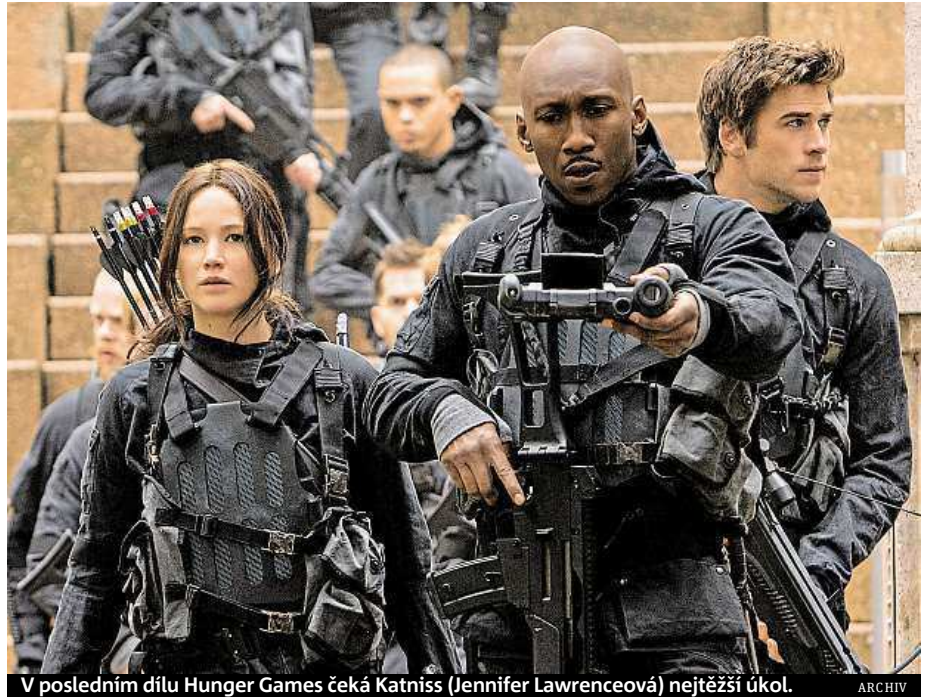
V posledním dílu Hunger Games čeká Katniss (Jennifer Lawrenceová) nejtěžší úkol.

Jednotka z 13. kraje se vydává na misi, jejímž cílem je zničit prezidenta a skoncovat s jeho tyranii. Na Katniss však tentokrát čeká mnohem nebezpečnější nepřítel, než s jakým se dosud kdy setkala v aréně. MET