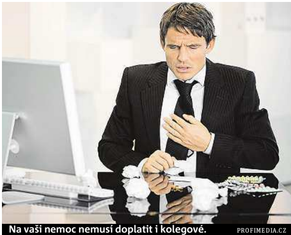
Na vaši nemoc nemusí doplatit i kolegové.

Mnozí totiž chodí do práce nemocní kvůli tomu, že nechtějí ztratit peníze. První tři dny nemocenské jsou neplacené a od čtvrtého do čtrnáctého dne poskytuje zaměstnavatel náhradu mzdy za pra-