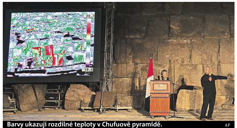
Barvy ukazují rozdílné teploty v Chufuově pyramidě.

Velké teplotní odchylky odhalil mezinárodní vědecký tým při skenování povrchu pyramid v egyptské Gíze.