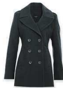
Carlo Cecci Dámský kabát