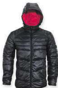
Jack & Jones Pánská bunda