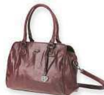
Carmelo Dámské kabelky