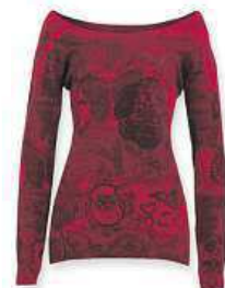
Desigual Dámský svetr