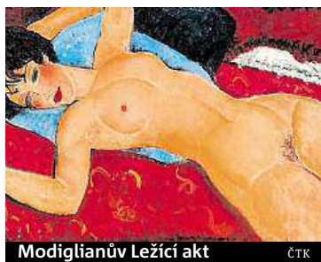
Modiglianův Ležící akt

Druhým nejdražším obrazem je Ležící akt od Modiglianiho.