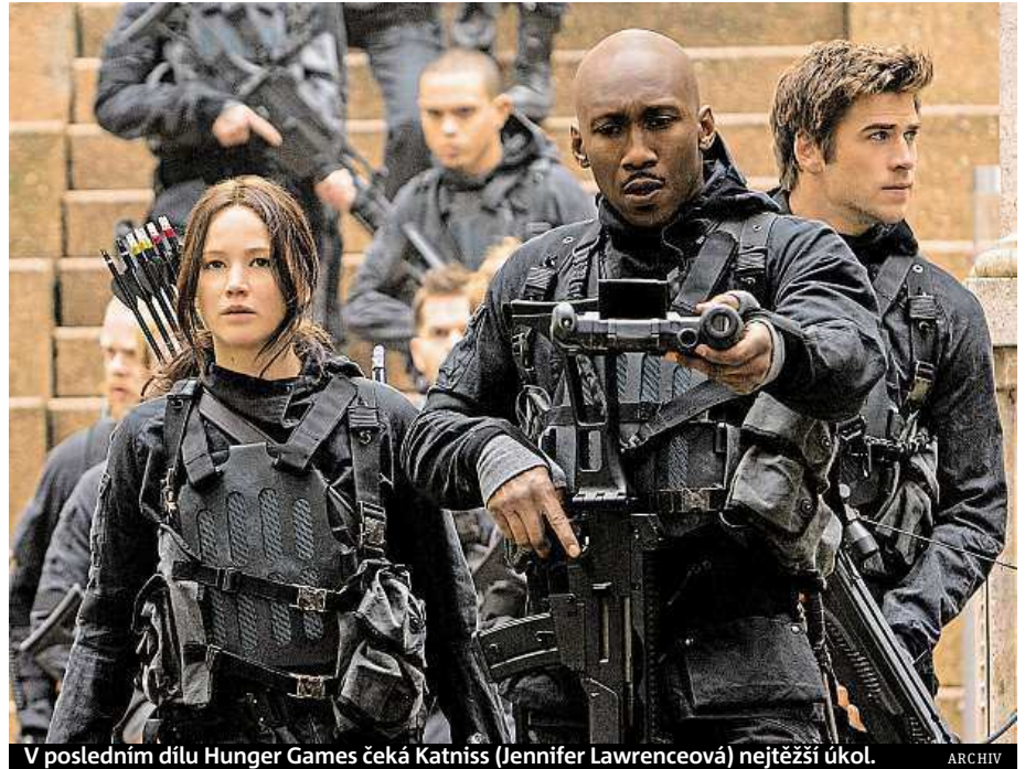
V posledním dílu Hunger Games čeká Katniss (Jennifer Lawrenceová) nejtěžší úkol.

Jednotka z 13. kraje se vydává na misi, jejímž cílem je zničit prezidenta a skoncovat s jeho tyranii. Na Katniss však tentokrát čeká mnohem nebezpečnější nepřítel, než s jakým se dosud kdy setkala v aréně. MET